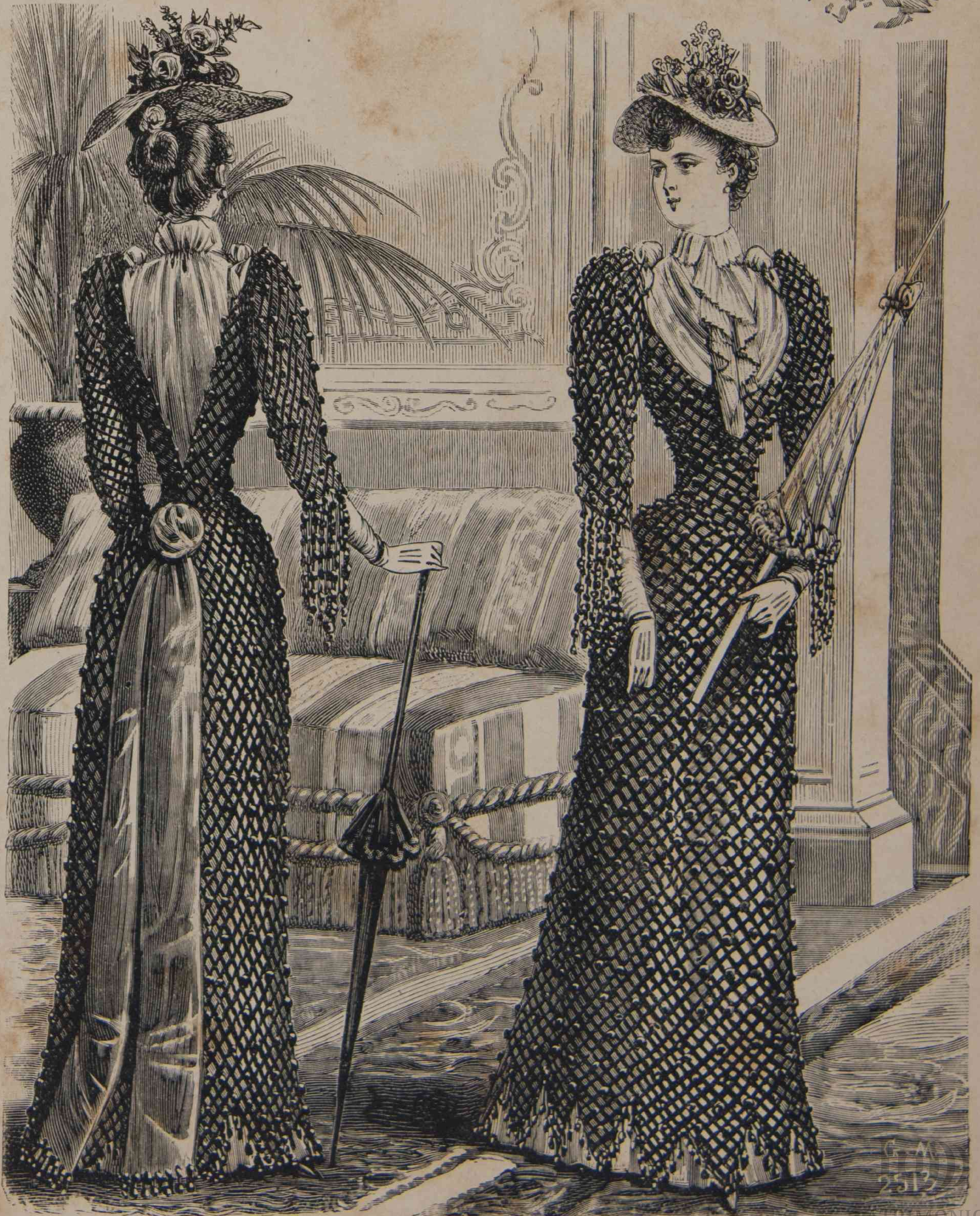
1 y 2. — Toilette de paseo (espalda y delantero).

El Grand Prix va á correrse dentro poco y el Paris que se divierte dirigirse en masa al hipódromo del Bois de Boulogne, no solo para ver correr los caballos, sino porque