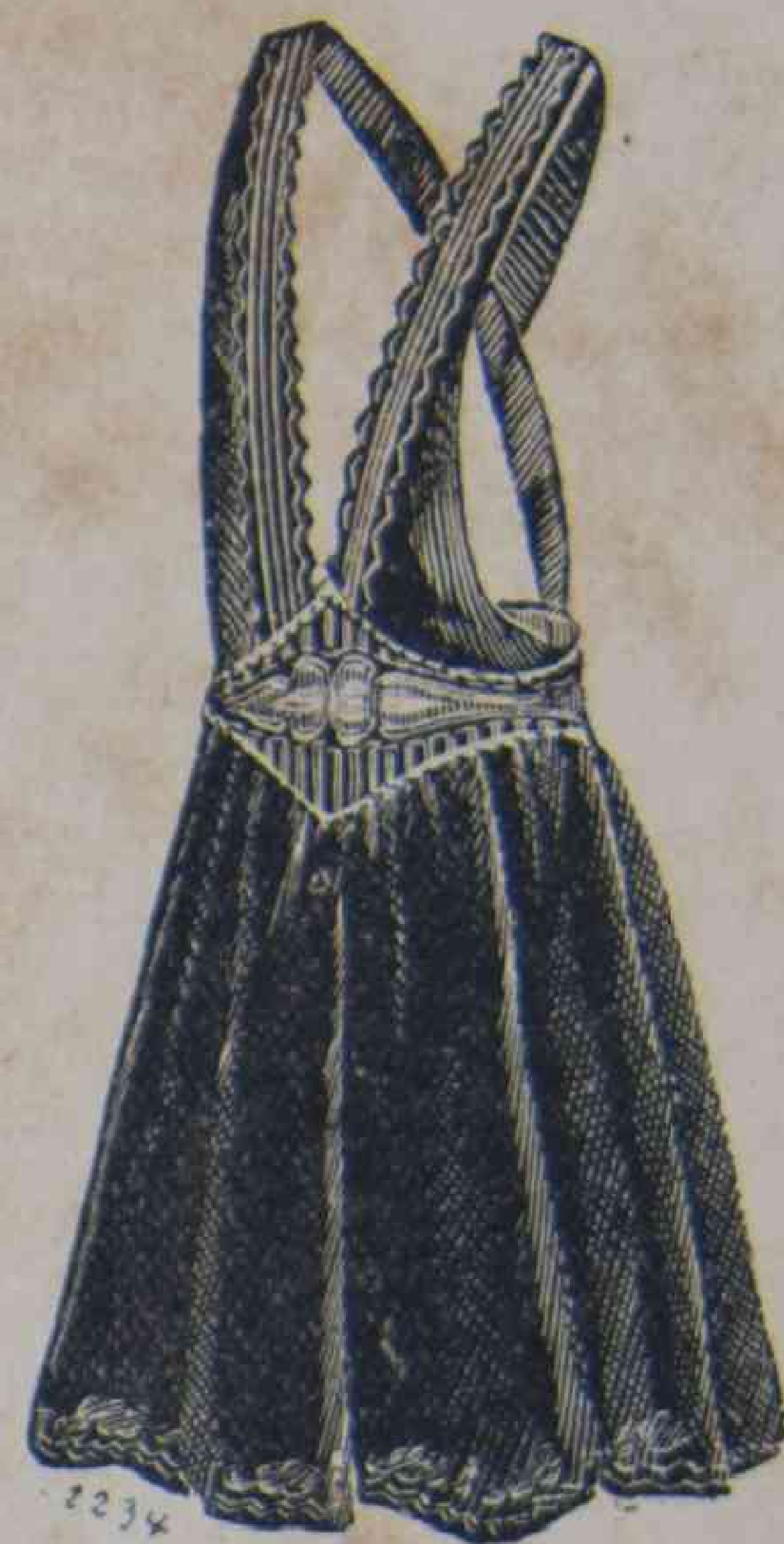
29. — Delantal para niño.

Los trajes de paseo y de visita, porque en el campo se visita siempre al vecino se las harán con las telas que hemos enumerado, más soignées , más elegantes según el objeto que se proponen, porque es necesario siempre hacer una diferencia entre las visitas sin pretensión que se hacen diariamente de puerta en puerta, por decirlo así, y las más ceremoniosas, aunque con una afectacion de sencillez que se cambian por la primera vez entre castillanas. Hay una serie de cosas que el tacto puede solo dar. Y es el conocimiento de la manera de vivir de las gentes, y de su caracter el que decide lo que es preferible hacer.