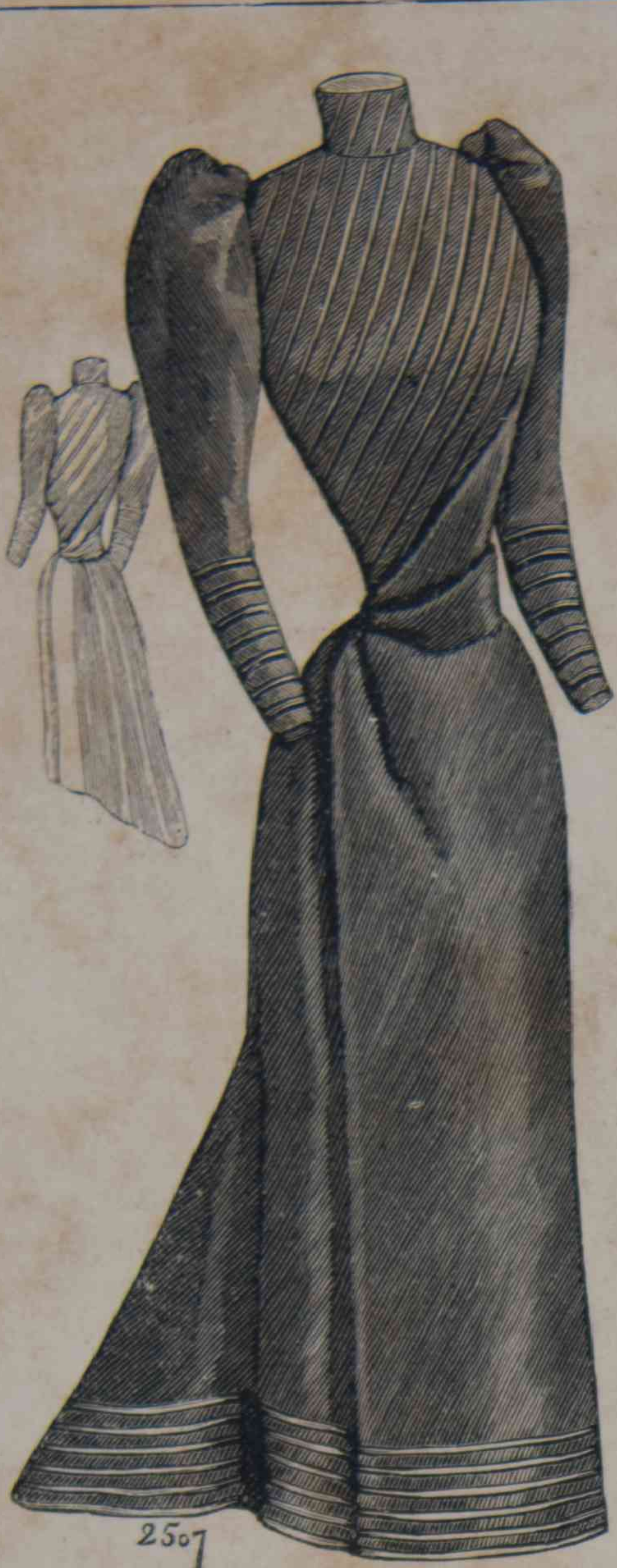
19 y 20.—Traje de calle (delantero y espalda).

Todos los trajes á cualquier orden que pertenezcan, están creados bajo la misma preocupación de tonalidad clara, con este algo joven y primaverál que dá á toda la toilette un aire de fiesta, lo que no quiere decir endimanché , ¡oh no! todo al contrario, por que hay una discreción en