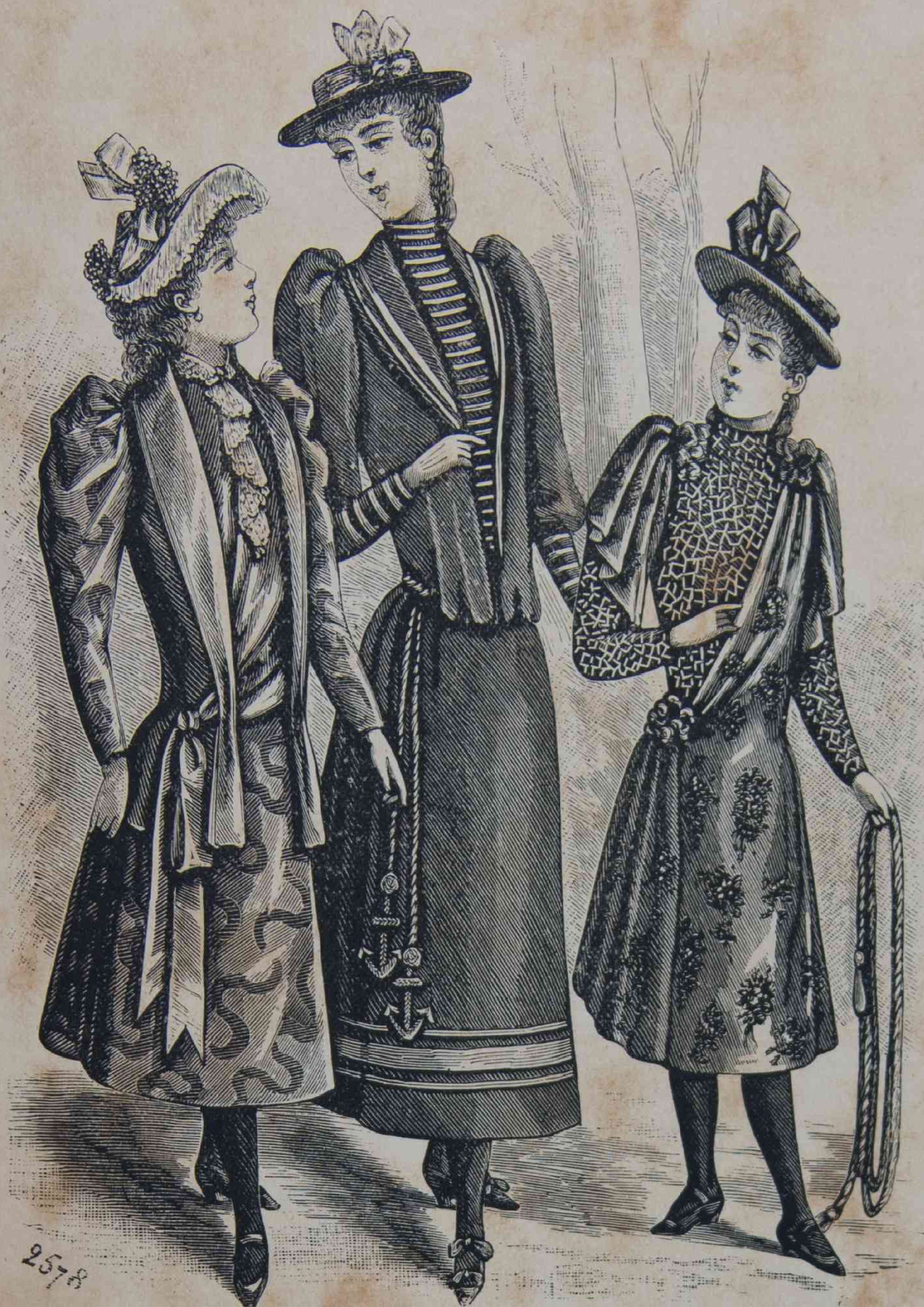
25 á 27. — Trajes de niñas.

ciendo un chaleco, una solapa unos falsos faldones, una falsa faltriquera ó bien un pasador en el borde de la veste .