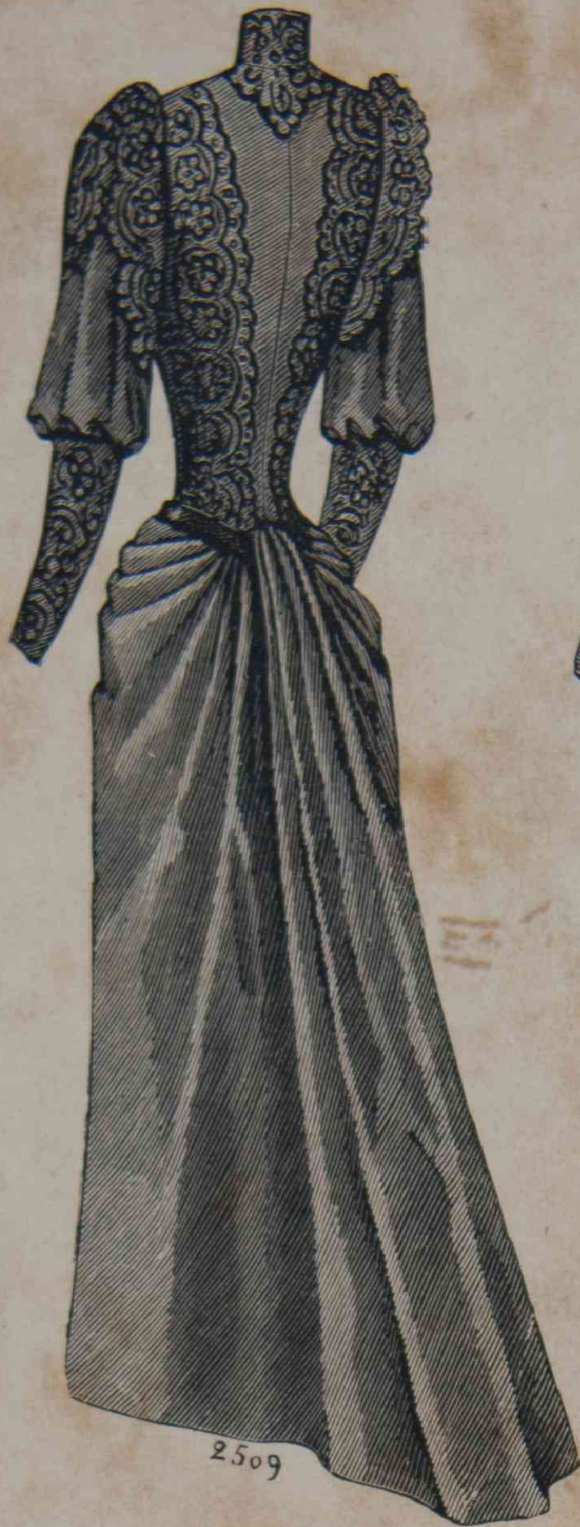
21.—Traje de vestir.