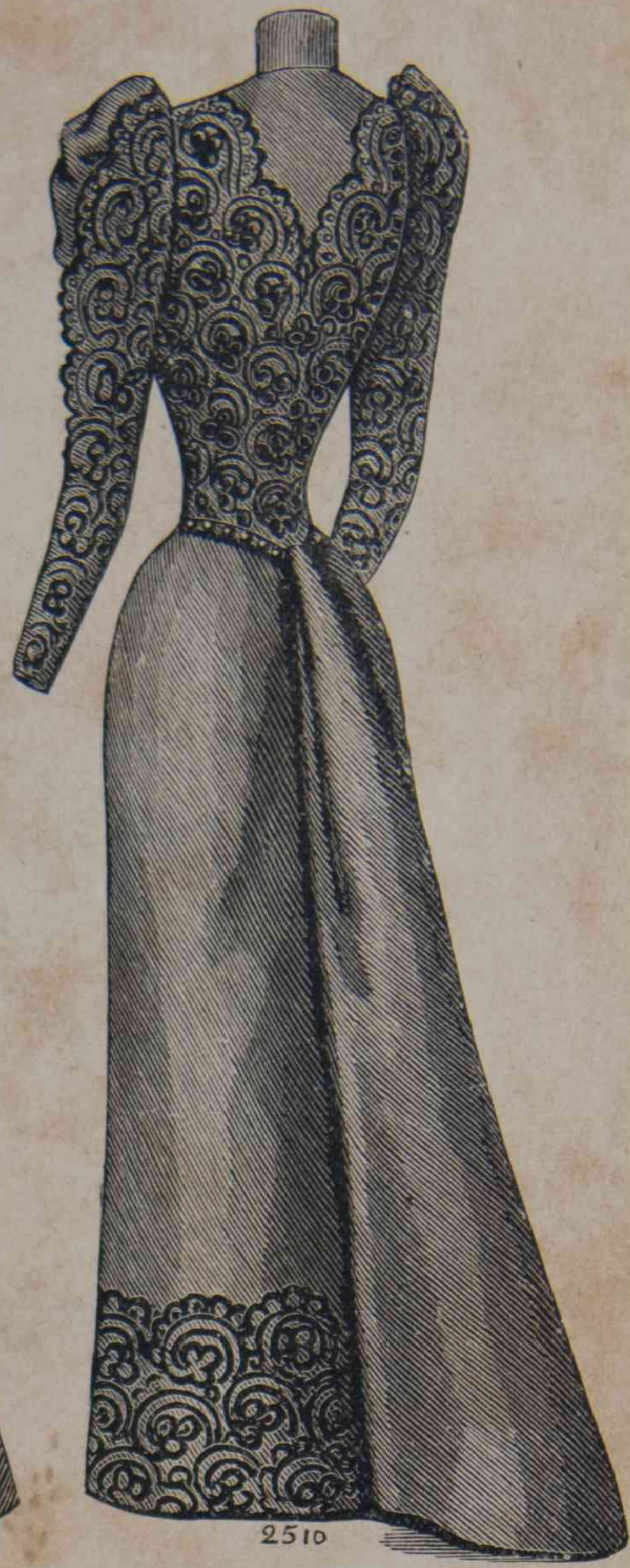
22.—Toilette de visita.

queño volante muy bajo adorna el borde del traje, una berta, un jabot , un gran cuello, jokeys cayendo en volante, ó bien dispuesta en corselete, en pequeña veste , corta, redonda ó cuadrada, concluyendo en el pecho. En cuanto al cinturón largo, cayendo en cabos en el costado ó siguiendo, detrás, las líneas de la cola, es el adorno juvenil por excelencia.