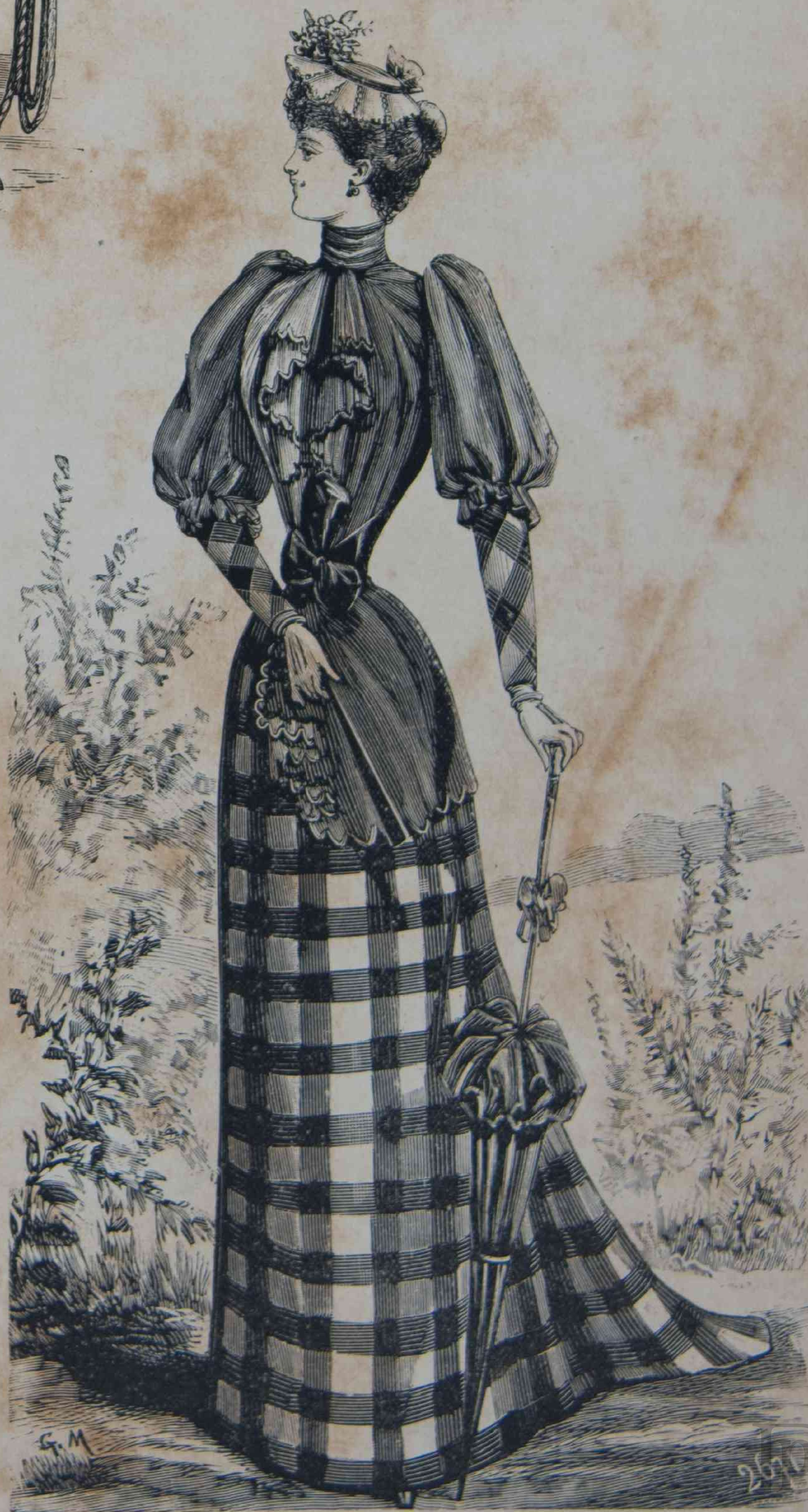
30. — Toilette de medio-luto.

La tela rusa muy ligera, es original con sus dos pequeñas costillas un poco grenues ; se emplea mucho de líneas negras sobre fondo claro. Las lanillas côtelés son en su mayoría, lo que facilita mucho la