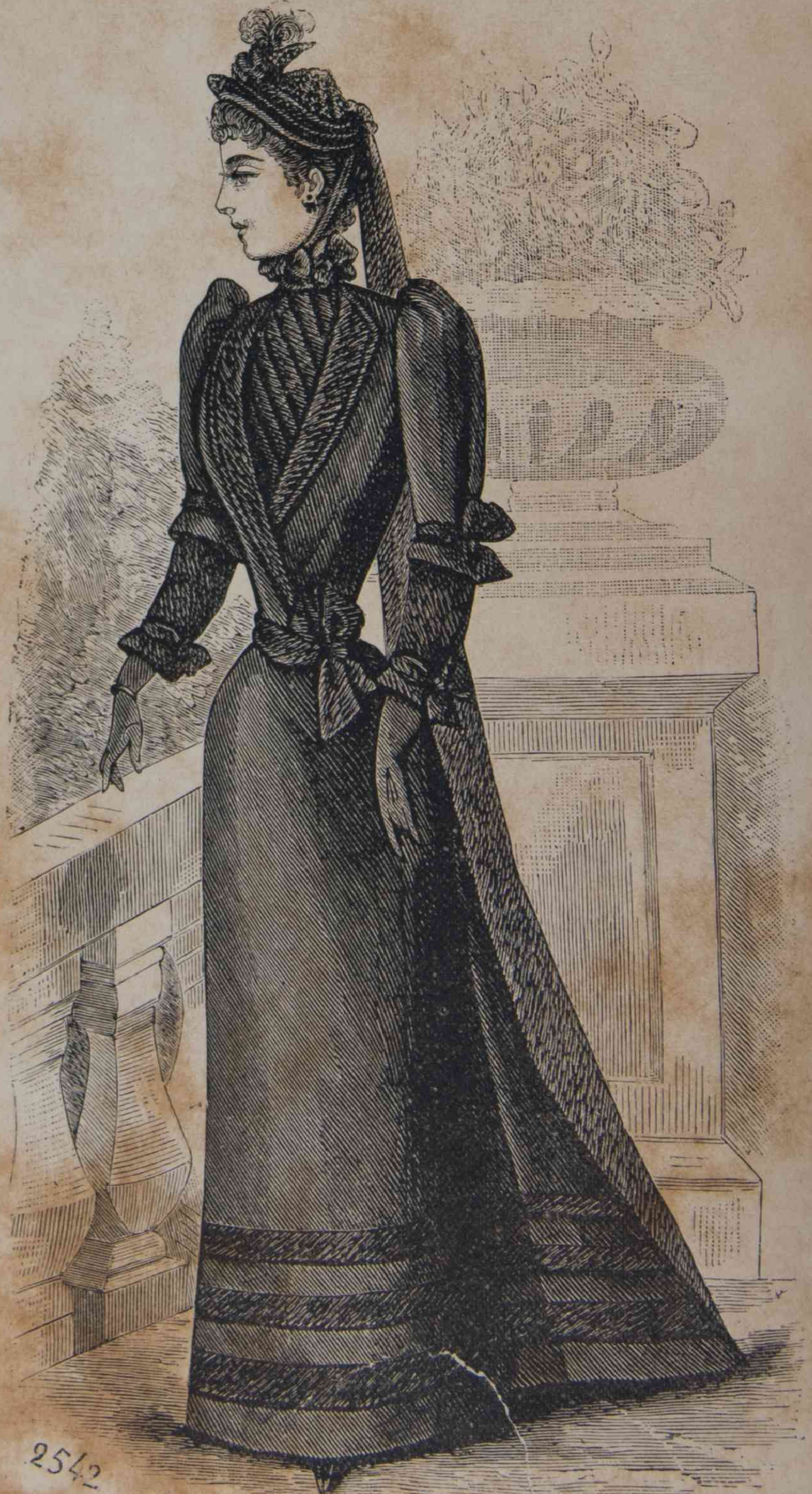
24.—Toilette de gran luto.

El encaje blanco, cuyo gran uso se hace siempre que el traje es más elegante, colocando al mismo tiempo una nota más lujosa, no quita al traje en carácter juvenil, por que está empleado con discreción y mucho arte; un pe-