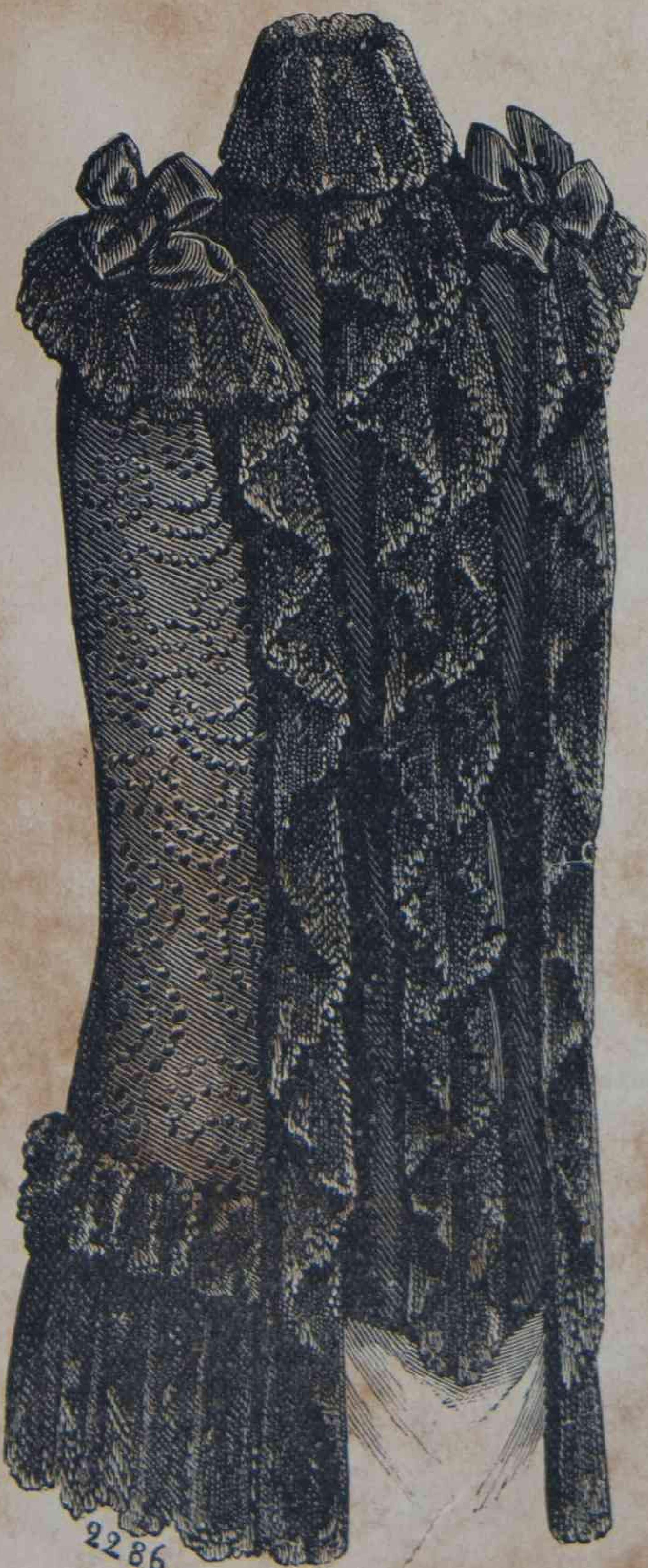
28. — Manteleta en faille negra bordada.

se hará tambien, dentro de la nota de sencillez muchas trajes graciosos en lanilla rayada, de colores tiernos, con aplicaciones de franela blanca por guarnición. Niñas y niños estarán vestidos del mismo gusto y podrán menearse sin estar oprimidos, por tejidos á la vez contra el calor y la humedad y á sus anchas con sus vestidos ligeros. La franela sea cual fuere el nombre pasagero que le dan en los mostradores de los almacenes, será la base de todos los trajes de la mañana, sin pretensión y que dejarán las señoras que están al campo ó á las orillas del mar para gozar el aire saludable, reposarse y pasearse en su jardín, porque gran número de señoras y aun de las más de-