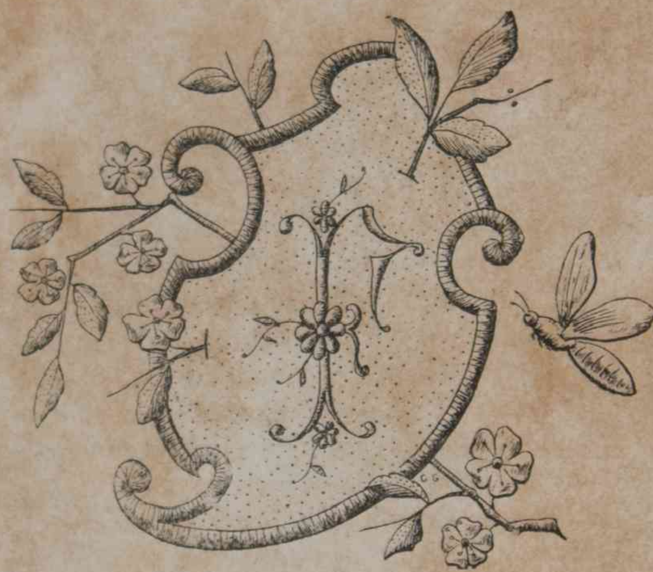
3 á 10 y 15 á 18. — Alfabeto florido con escudos variados.

rón con largos cabos. Cuello y cinturón en galones bordados de plata. Mangas ondeadas y abolladas, adornadas de nudos y brazaletes en cinta azul pálido. Toca en flores azules, adornada de cintas azul pálido. Guantes de suecia trigo. Sombrilla de gaza azul, adornada de nudos y de cinta y de un volante plegado.