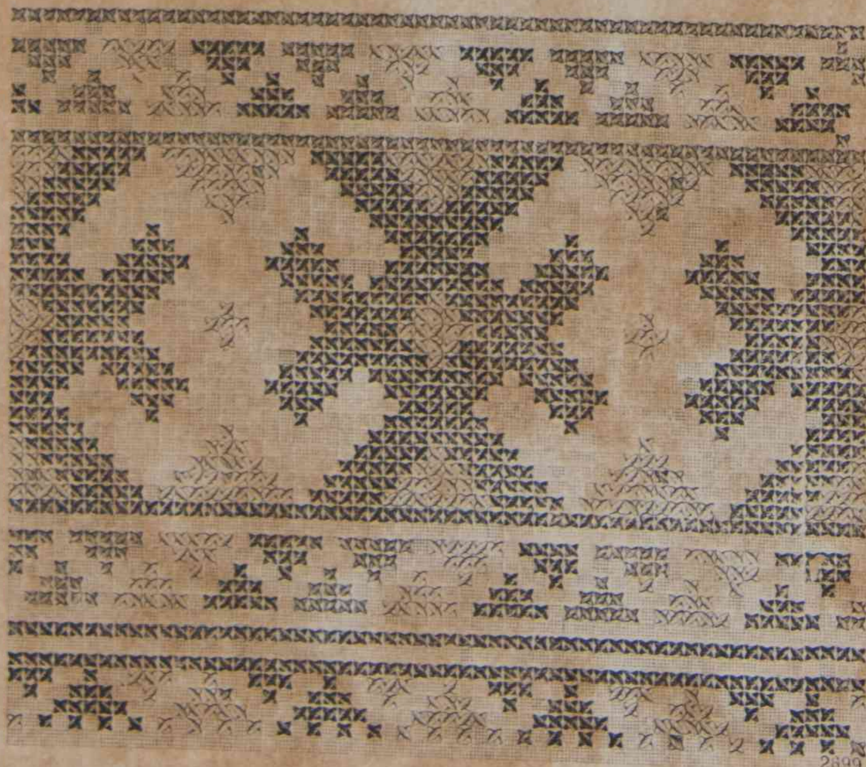
11. — Guarnición en bordado ruso.

22. —Toilette de visita. —Falda-funda delantero, con cola cornet por detrás, en pelantine rojo viejo, adornado en los bajos de un alto encaje de Venecia negro colocado llano. Cuerpo