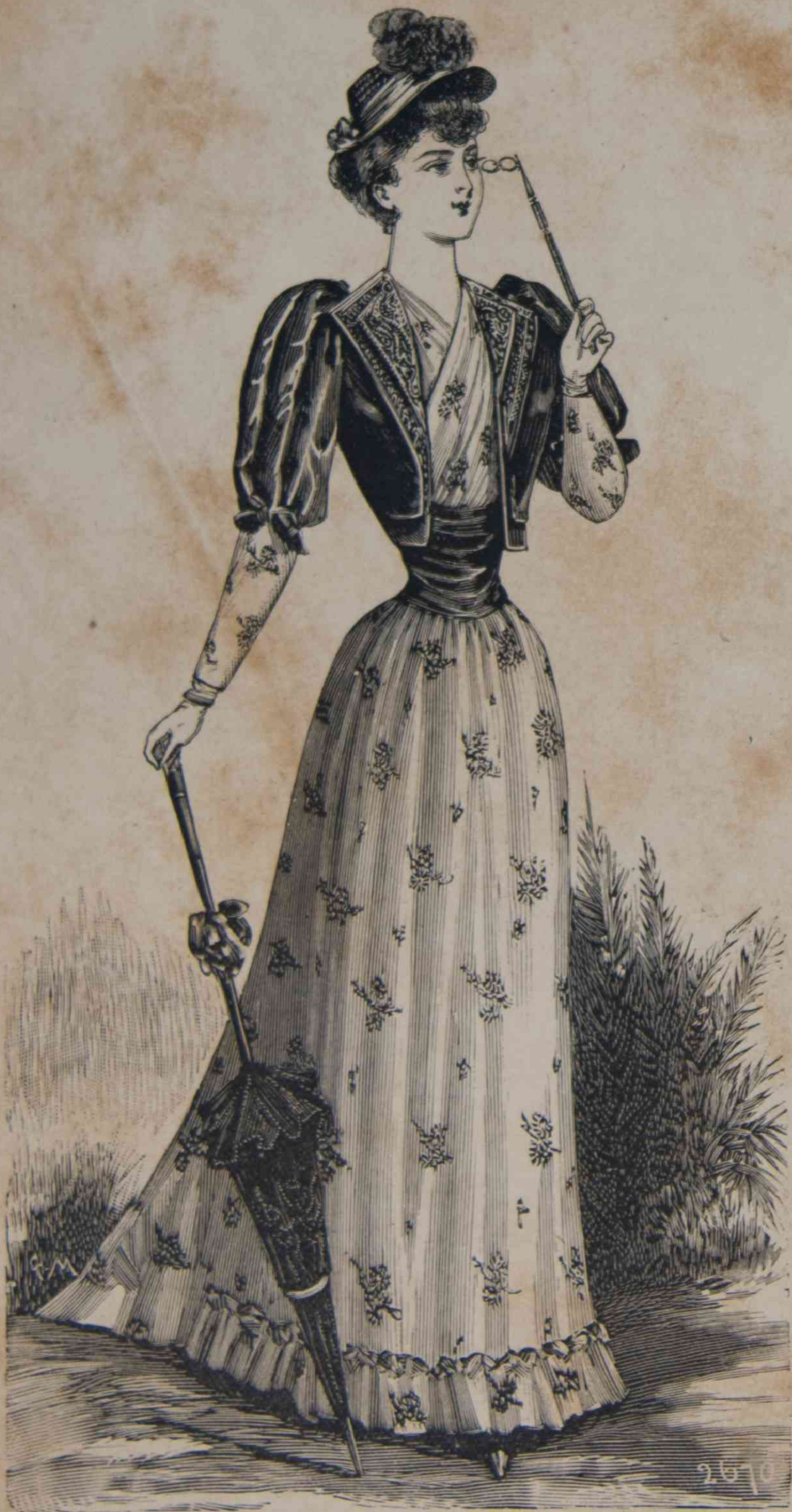
23.—Toilette de Exposición con Veste Doña Sol.

Los adornos blancos van también al mismo objeto; los hay de muchísimas maneras. En los trajes de seda ó de lánilla ligera, se colocan lazos y nudos de raso blanco, de tafetás, de ottoman , pero en los trajes que requieren la veste y el chaleco género Sport, esta nota blanca, muy apreciada, la dá la misma tela, ha-