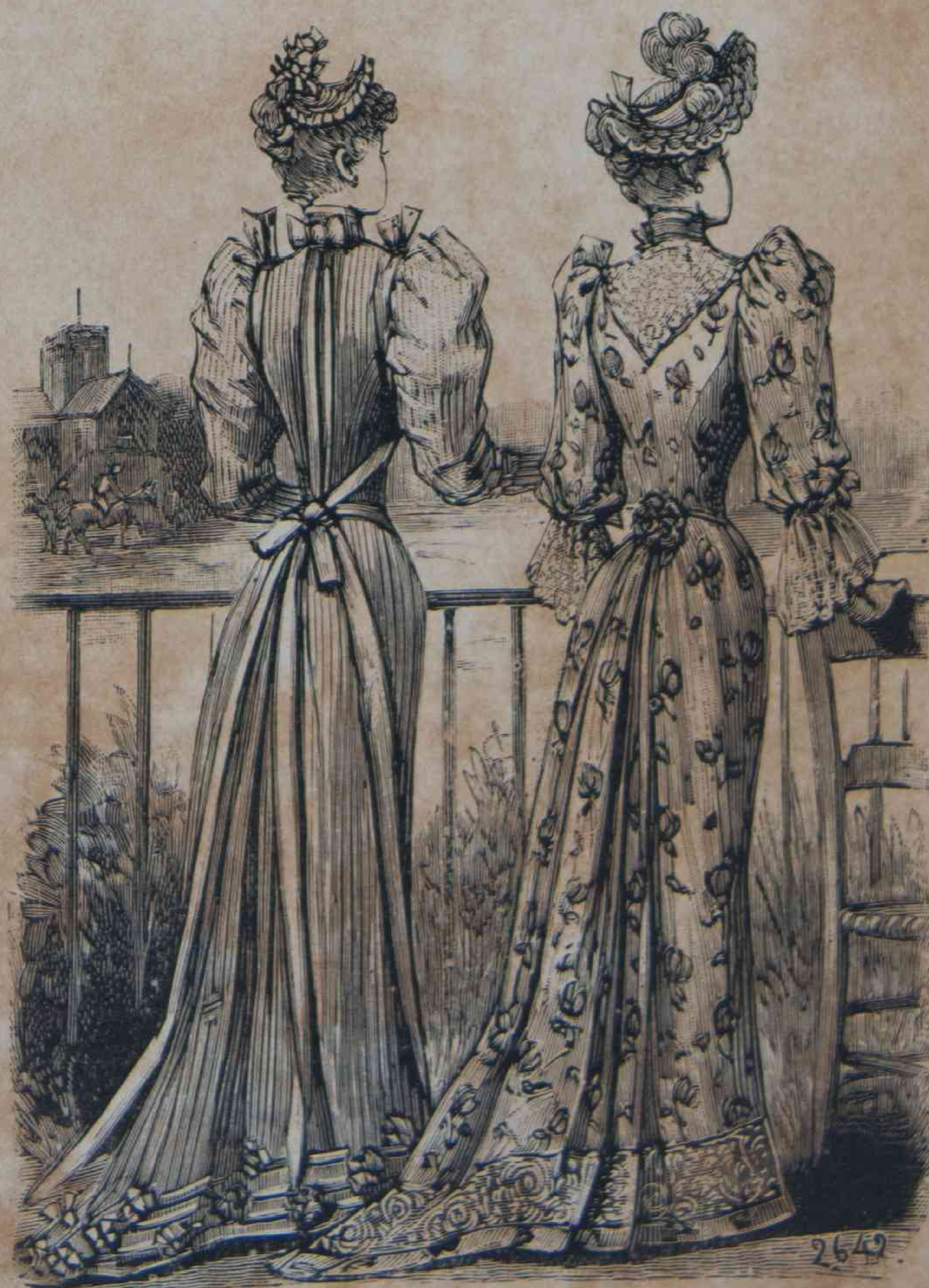
Toilettes de carreras, espalda del figurin en color n° 36. (Vease las explicaciones, pagina 234.)

Ahora se la consumian las chulas, es decir, la chula, la Nicanora, la única reina de su corazón por el momento.