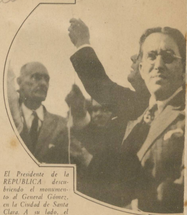
El Presidente de la REPUBLICA descubriendo el monumento al General Gómez, en la Ciudad de Santa Clara. A su lado, el Alcalde de La Habana.

El Mayor General José Miguel GOMEZ, figura insigne de la epopeya libertadora, segundo Presidente de la República, que en la guerra y en la paz contribuyó a mantener puro el concepto de cubanidad. El pueblo de Cuba, que venera la memoria del caudillo, le ha erigido un monumento en Santa Clara.