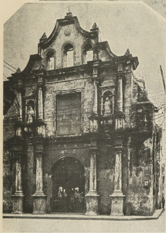
Fachada principal de la Iglesia de Paula, tal cual se encuentra en la actualidad.