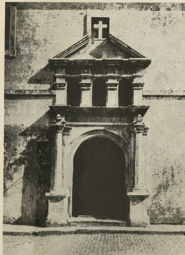
Entrada principal del viejo Hospital de San Francisco de Paula, ya demolida.