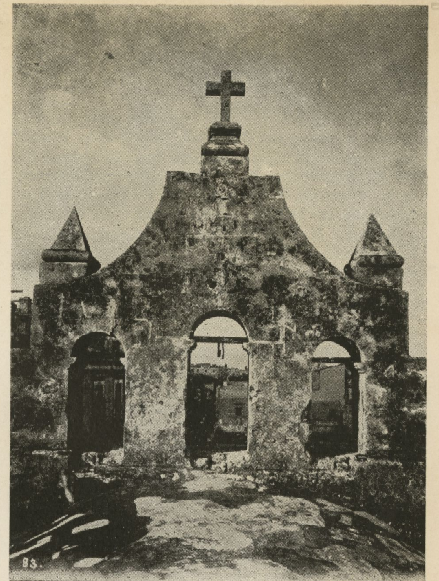
Parte posterior del campanario de la Iglesia de Paula.

Según refiere uno de los tres primeros historiadores de Cuba, Antonio J. Valdés, en su Historia de la Isla de Cuba y en especial de La Ha-