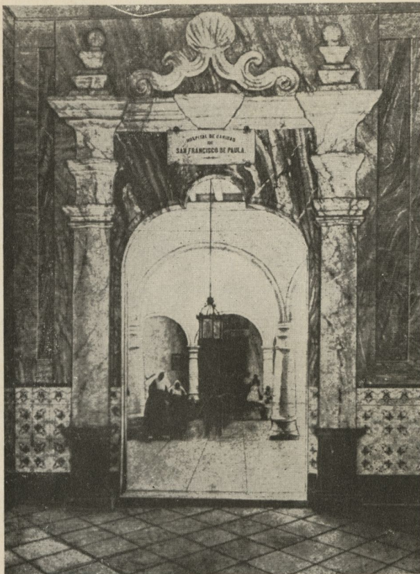
Vestibulo del Hospital de San Francisco de Paula, demolido actualmente.

la sanidad en Cuba durante los últimos cincuenta años (1871-1920), afirma que "aunque sus condiciones guardaban relación con la época en que se fabricó, por su buena administración gozó siempre de la mejor fama como establecimiento nosocomial".