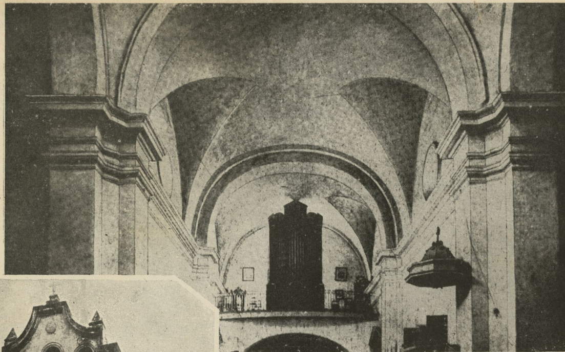
Nave de la Iglesia de Paula, dejando ver las bóvedas que la cubrían.