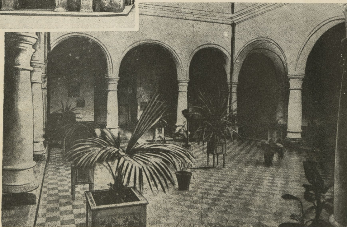
Patio central del Hospital de San Francisco de Paula, que estuvo emplazado junto a la Iglesia del mismo nombre.

queología y Etnología, de acuerdo con las facultades que le concede el Decreto núm. 1932, de 16 de junio de 1944, publicado en la Gaceta Oficial, segunda edición, del 7 de julio, solicitó del Gobierno, por conducto del Sr. Ministro de Educación, sea declarada Monumento Nacional, a fin de preservarlo de su destrucción y lograr su restauración.