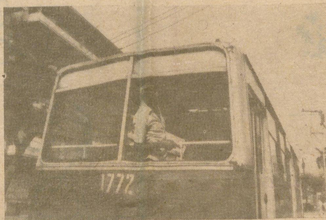
Guagua con balcón a la calle.