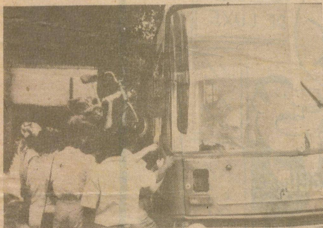
¡Cuidado con la bicicleta de mi hijo!