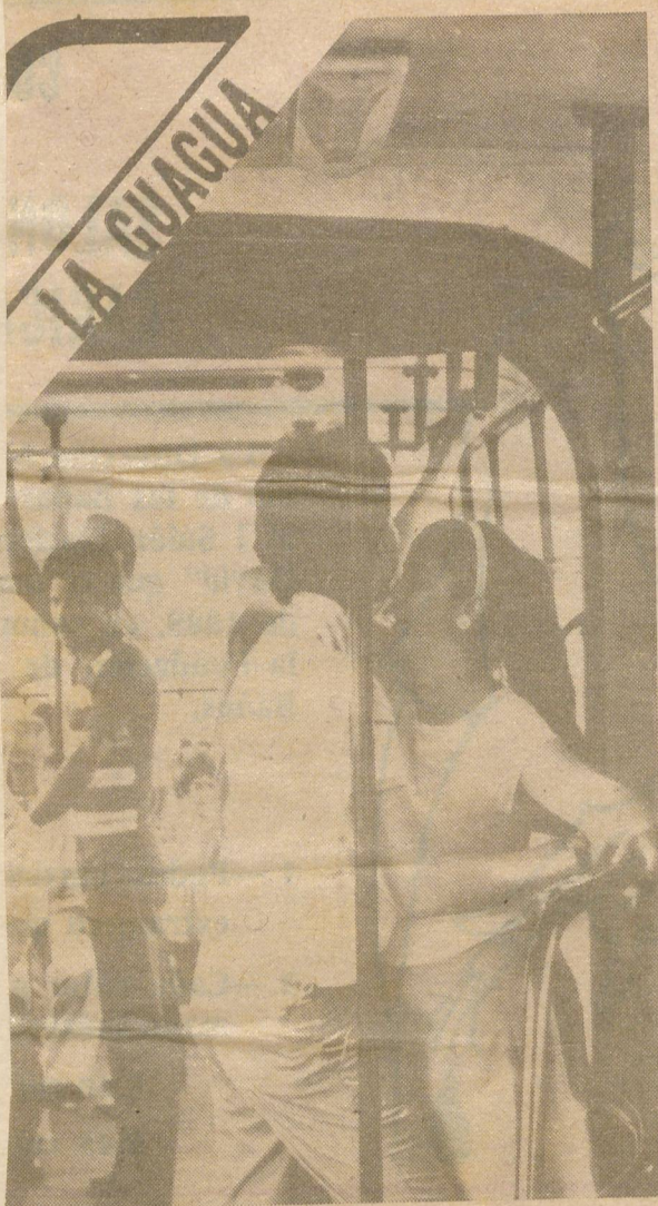
El amor triunfa hasta en las guaguas.