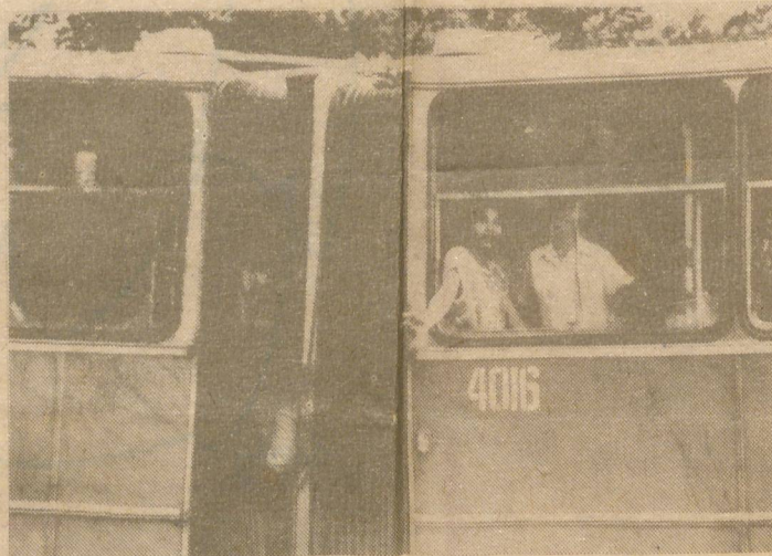
Salida de emergencia.

Por el momento disfruten de estas imágenes, y que tengan suerte.