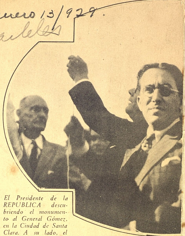
El Presidente de la REPUBLICA descubriendo el monumento al General Gómez, en la Ciudad de Santa Clara. A su lado, el Alcalde de La Habana.

El Mayor General José Miguel GOMEZ, figura insigne de la epopeya libertadora, segundo Presidente de la República, que en la guerra y en la paz contribuyó a mantener puro el concepto de cubanidad. El pueblo de Cuba, que venera la memoria del caudillo, le ha erigido un monumento en Santa Clara.