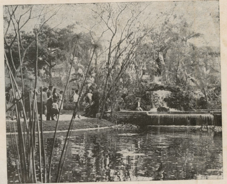
Un rincón natural.