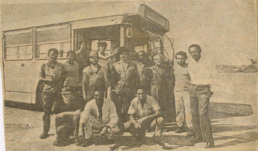
PARTE DE los trabajadores que responden por el mantenimiento de los ómnibus FIAT en la terminal ISPJAE.