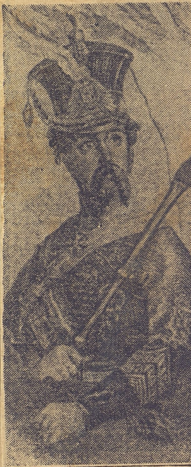
El Conde de Belascoain, fusilado en Madrid por Espartero y que dió su nombre a la Calzada, como un homenaje que le tributó O'Donnell a su memoria.