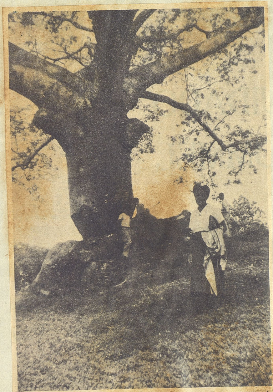
La ceiba milenaria medía 13 metros de perímetro en el tronco. La foto fue tomada cuando los trabajadores estaban a punto de derribarla.