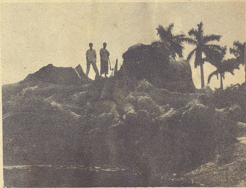
Las raíces de la ceiba formaban una montaña, cuyas ramificaciones se extendían por toda una manzana, a gran profundidad.