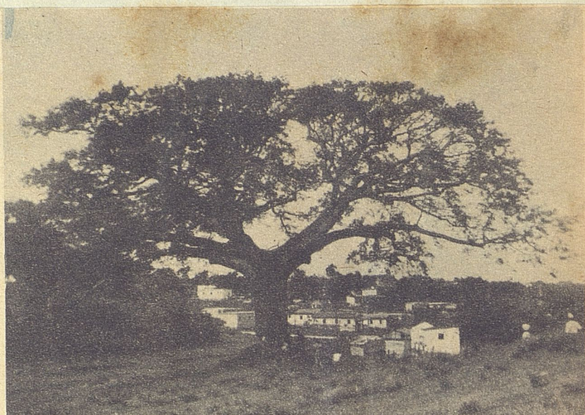
Un aspecto del gigante del Reparto Párraga: el diámetro de la copa era de cerca de ochenta metros. La altura, más de treinta.