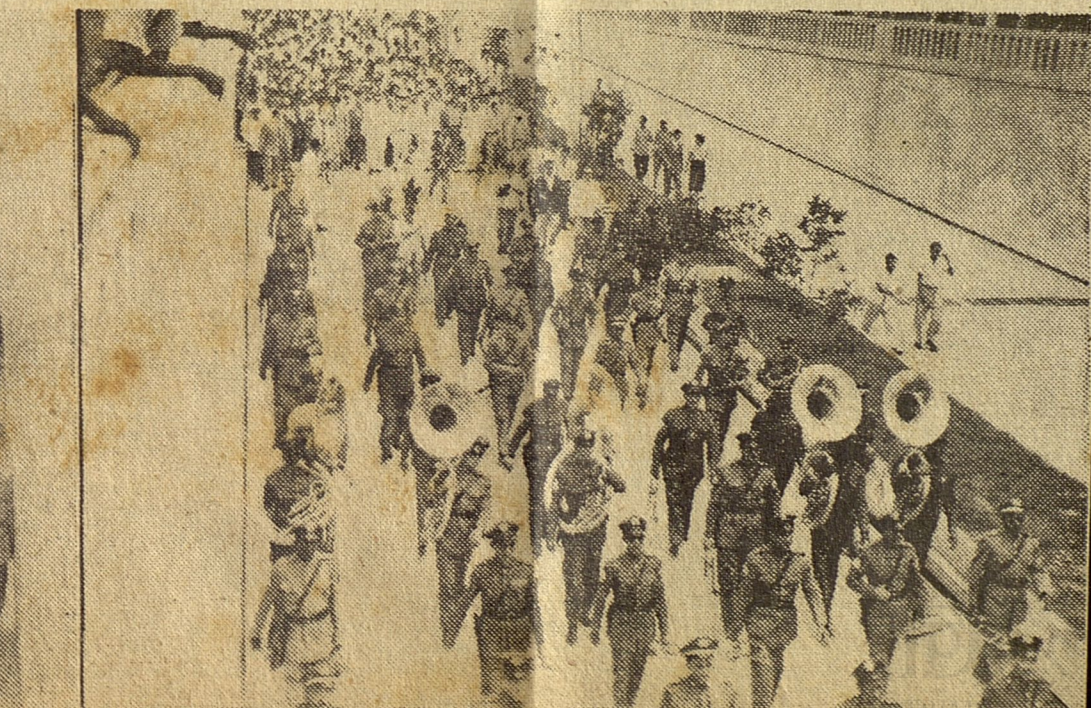
A las doce del día de hoy quedó inaugurado el túnel que une a La Habana con Marianao. La tira gráfica ofrece tres aspectos del acto.