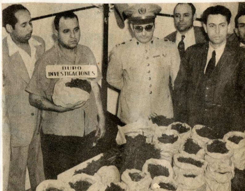
Sacos de goma, impermeables, conteniendo marihuana procedente de México y traída de contrabando a Cuba a través de los vapores mercantes que cubren las rutas del Caribe. Posiblemente este cargamento venga de las tierras áridas de la Baja California.