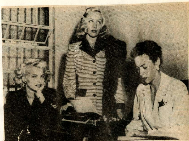
El vicio de la marihuana es una plaga extendida a través de todas las clases sociales, tanto en Cuba como en el extranjero. En los Estados Unidos cuenta entre sus víctimas con figuras prominentes de la colonia cinematográfica como Lila LEEDS y Vickie EVANS, recientemente sorprendidas en compañía del actor Robert MITCHUM, cuando fumaban la terrible "yerba loca".