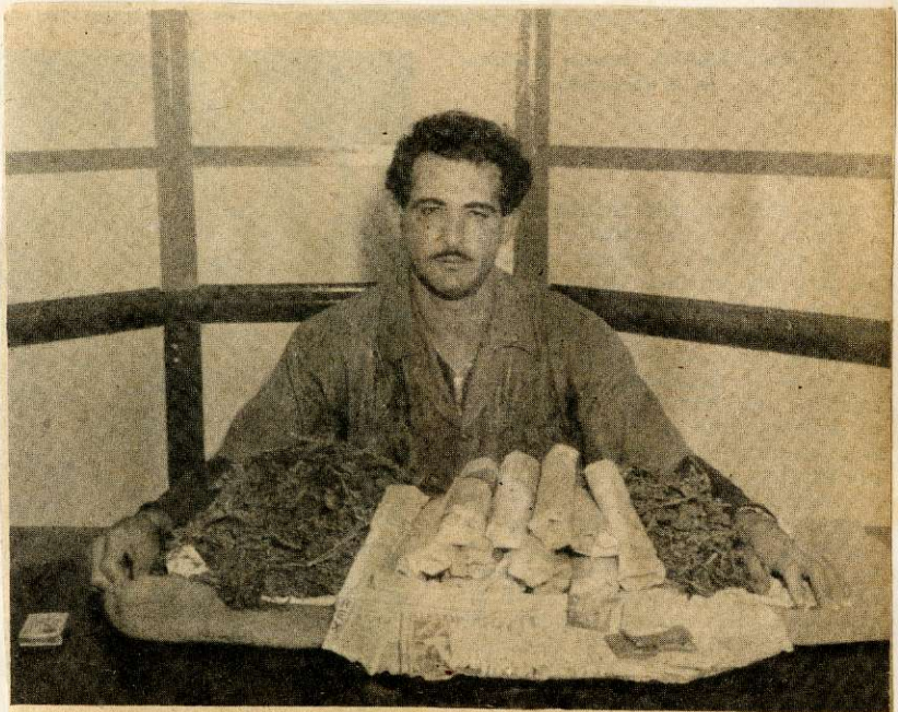
Un típico "jibarito", capturado con una carga de marihuana en rama y cigarrillos, y sobres listos para ser entregados a sus clientes viciosos.