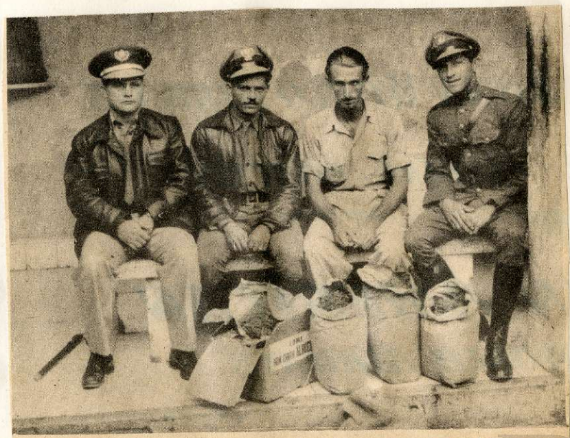
Un gran embarque de marihuana, cosechada en Cuba y sorprendido en Bayamo, uno de los centros de distribución de donde sale, rumbo a La Habana, la droga obtenida en las lomas de Sierra Maestra.