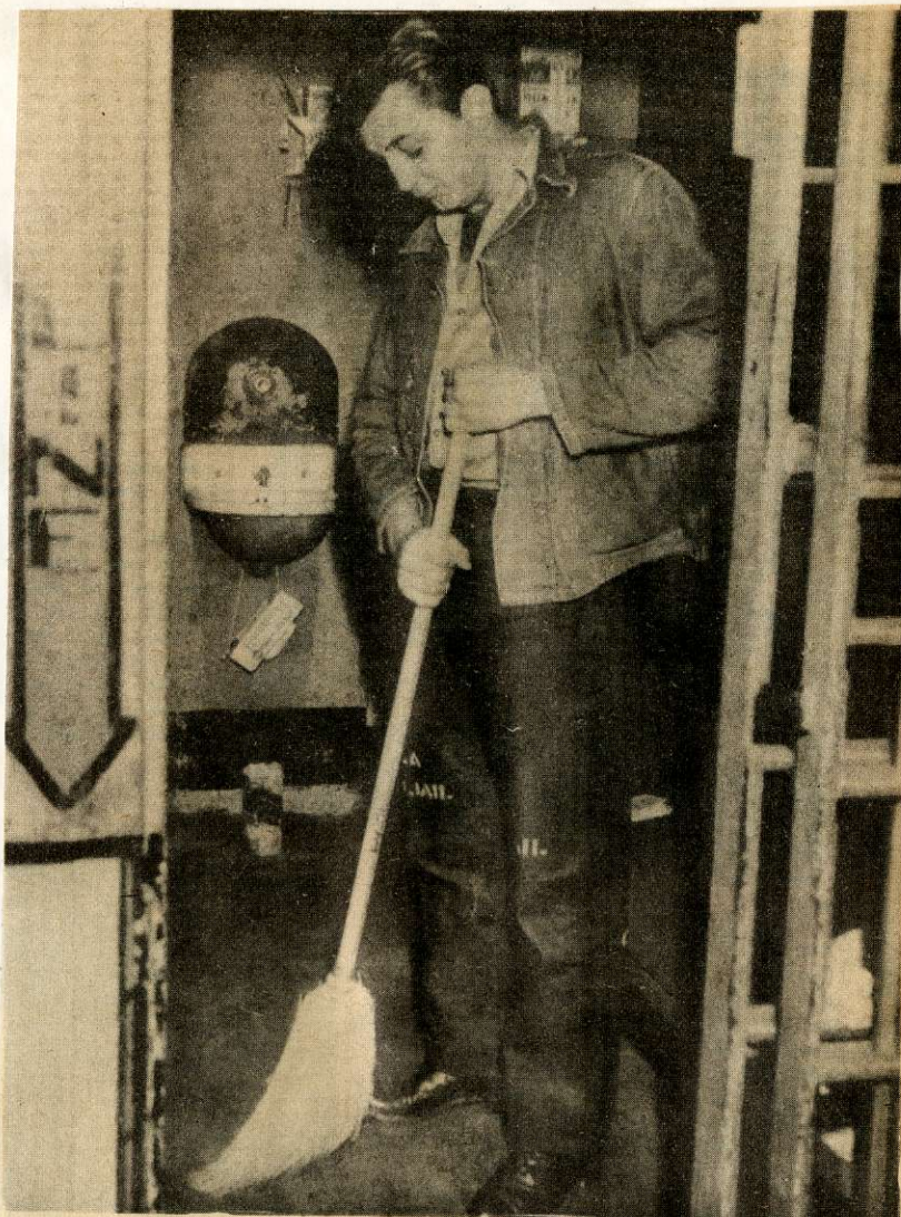
Robert MITCHUM, el famoso actor del cine, barriendo la celda de la prisión de Los Angeles en que cumplió condena de dos meses por fumar marihuana.