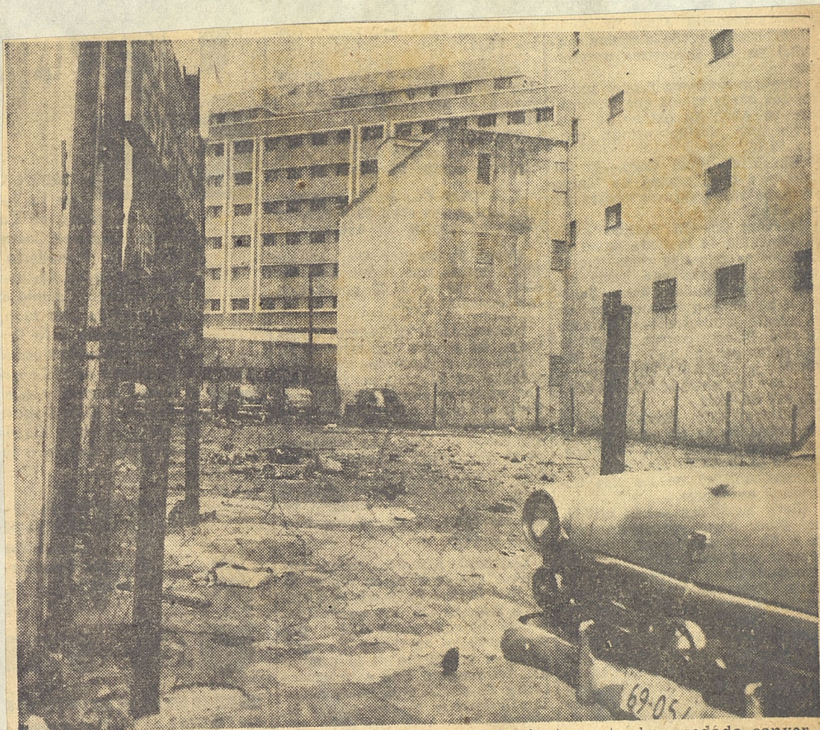
Junto al Carreño, este solar, pese a estar cercado convenientemente, ha quedado convertido en un basurero. Los inquilinos de la gran casa de inquilinato han encontrado más cómodo lanzar allí sus desperdicios que esperar por el carro de la basura. Y Salubridad no se ha dado por enterada de la existencia de ese basurero en un lugar donde constituye un espectáculo lamentable y un foco de infección.