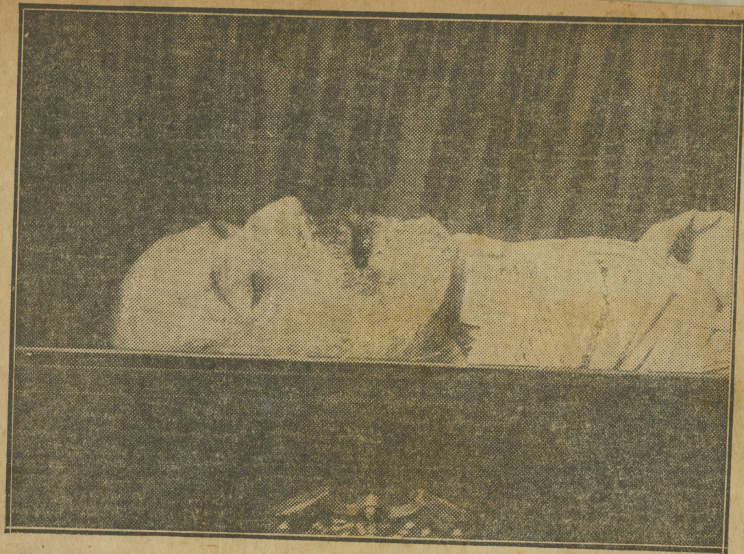
El cadáver del general Weyler en la capilla ardiente