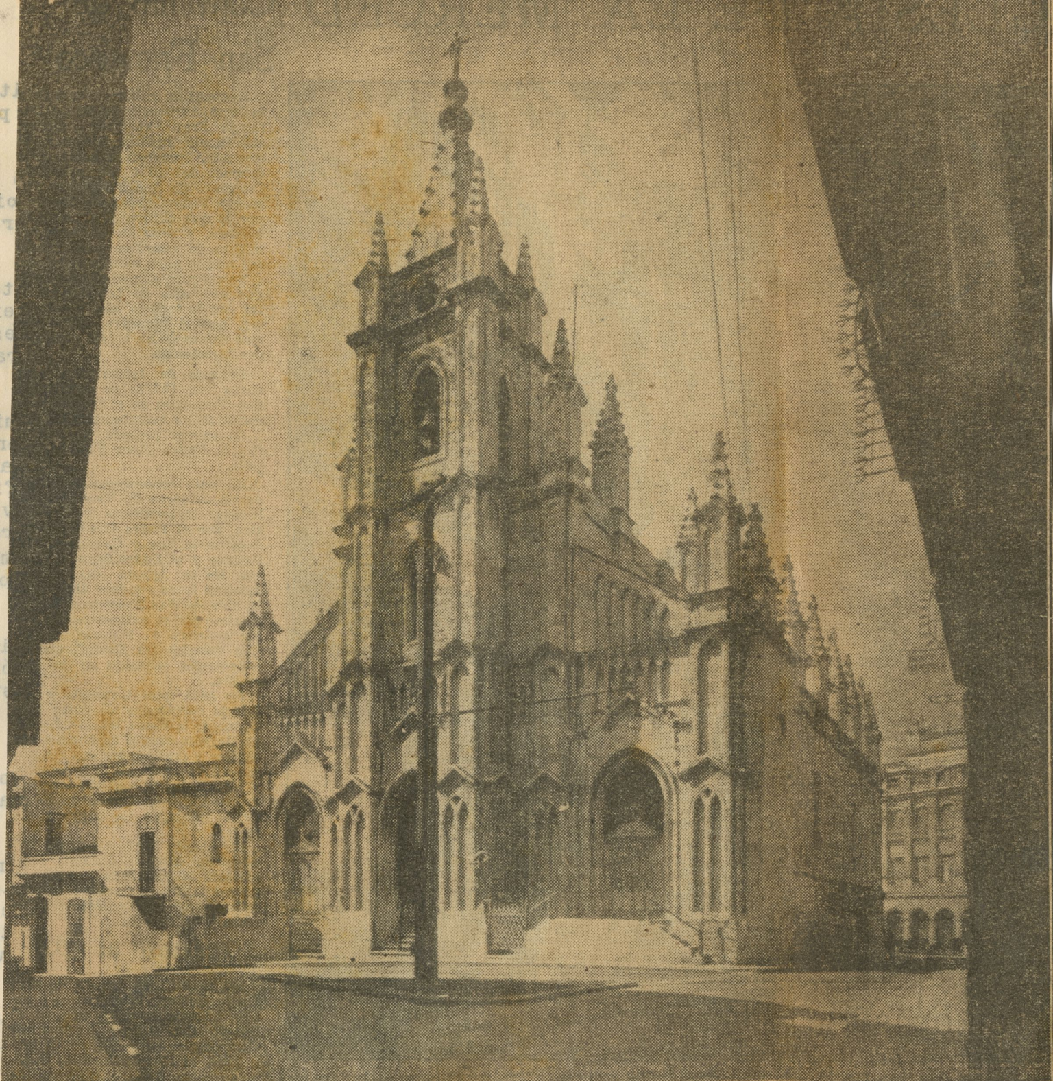
Una magnífica vista general de la Parroquia del Santo Angel Custodio, ubicada en las calles de Compostela, los Cuarteles y Monserrate, frente a lo que era antaño la cima de la Loma de Peñapobre, que al transcurrir los años, y en virtud de haberse construido allí la iglesia, fué en lo adelante conocida como Loma del Angel.