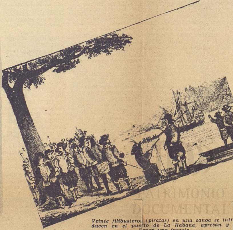
Veinte filibusteros (piratas) en una canoa se introducen en el puerto de La Habana, apresan y llevan una fragata.

Handwritten text in Spanish, likely a legal document or record, with some illegible parts. Includes a circular stamp at the bottom right.