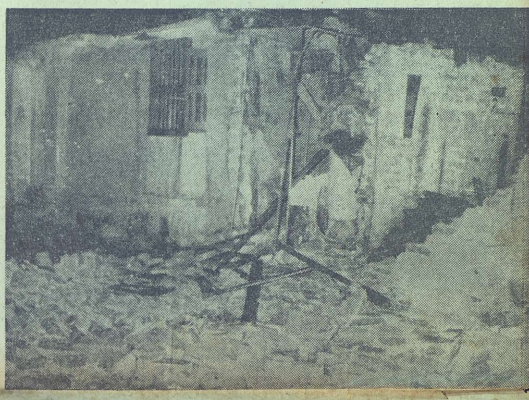
En la foto puede apreciarse una parte de las construcciones del central "Elia", en Camagüey, convertida en escombros por los efectos del violento huracán que azotó esta zona.