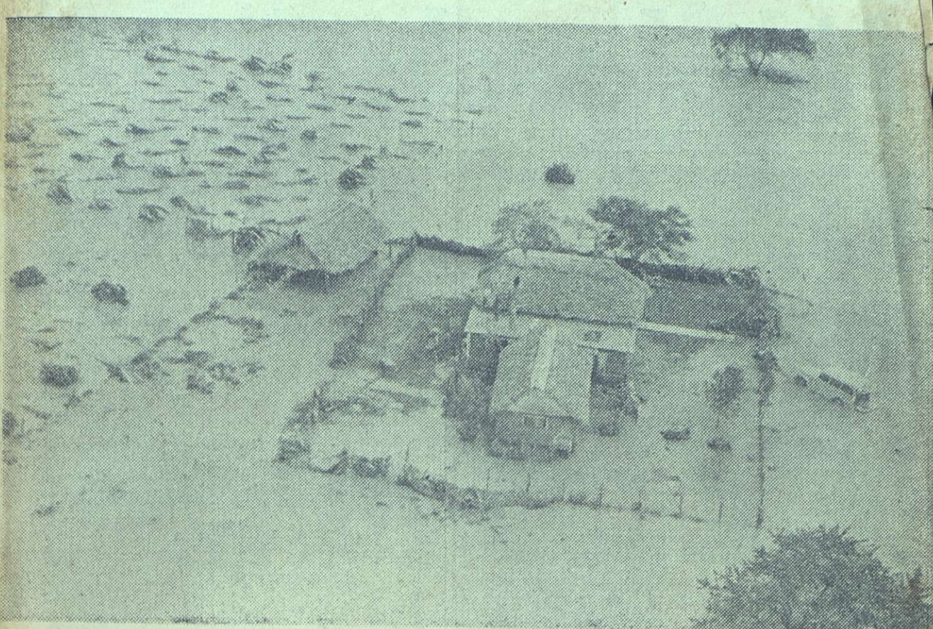
Los fértiles campos sembrados quedaron inundados por las aguas de los ríos. La gráfica aérea muestra sólo un aspecto de la situación general que presentan las regiones azotadas por el ciclón. Viviendas anegadas, vehículos semitapados por el agua y sembrados destruidos. Tal es el resultado general después del paso del ciclón. Muchos orientales, como los que se aprecian en la foto, tuvieron necesidad de subir a los techos de sus viviendas para escapar de las aguas.