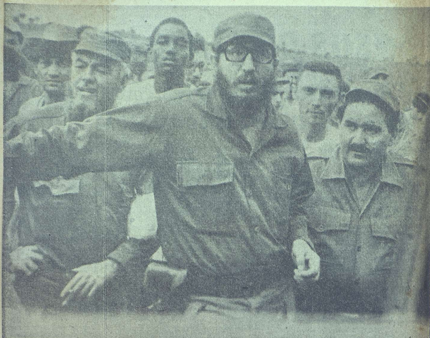
Al frente de las brigadas de auxilio a los damnificados del ciclón, el Primer Secretario del PURS y Primer Ministro del Gobierno Revolucionario, comandante Fidel Castro, se dispone a tomar un helicóptero para trasladarse a las zonas devastadas. Junto a Fidel aparecen los comandantes Armando Acosta y René Vallejo, así como otros compañeros que trabajan directamente en las labores de salvamento y avituallamiento de los damnificados.