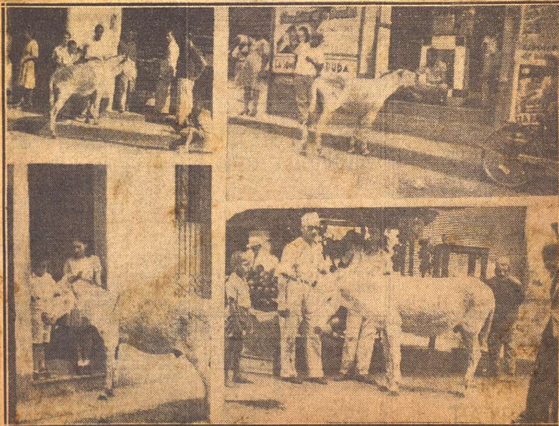
En el mercado, en los puestos, en las casas particulares, «Perico» se busca la pitanza «de botella», demostrando que no es tan burro como parece.

J. López Santa Eulalia. Santa Clara, agosto de 1943.