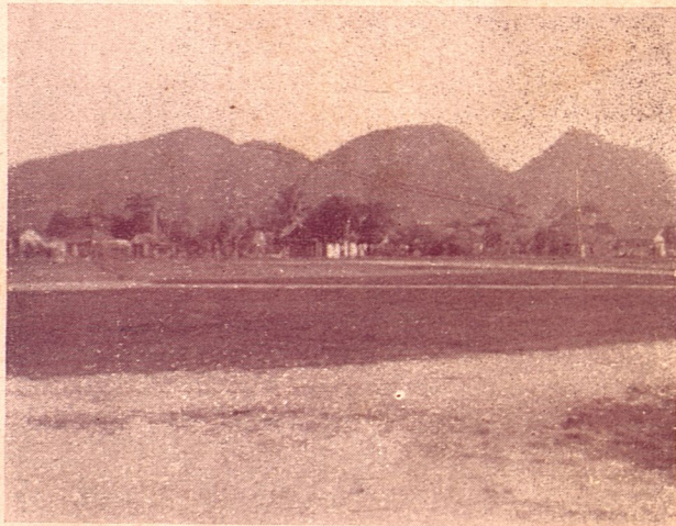
La Sierra de Casas, en Isla de Pinos.