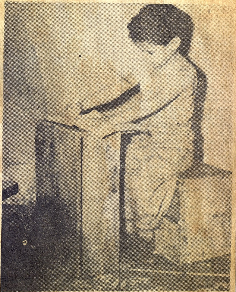
Un escolar cubano, de una escuela de la capital de la República y bajo la regencia educacional de Aureliano Sánchez Arango, "propulsor" del pomposamente llamado "Año del Material Escolar", utiliza un cajón, como lo muestra la foto,

en lugar de pupitre, para realizar sus trabajos en el aula. Una vergüenza nacional, que no ha querido reparar el actual Ministro, pese a que nunca antes, en la vida republicana, el Ministerio de Educación ha tenido un presupuesto tan elevado como el actual