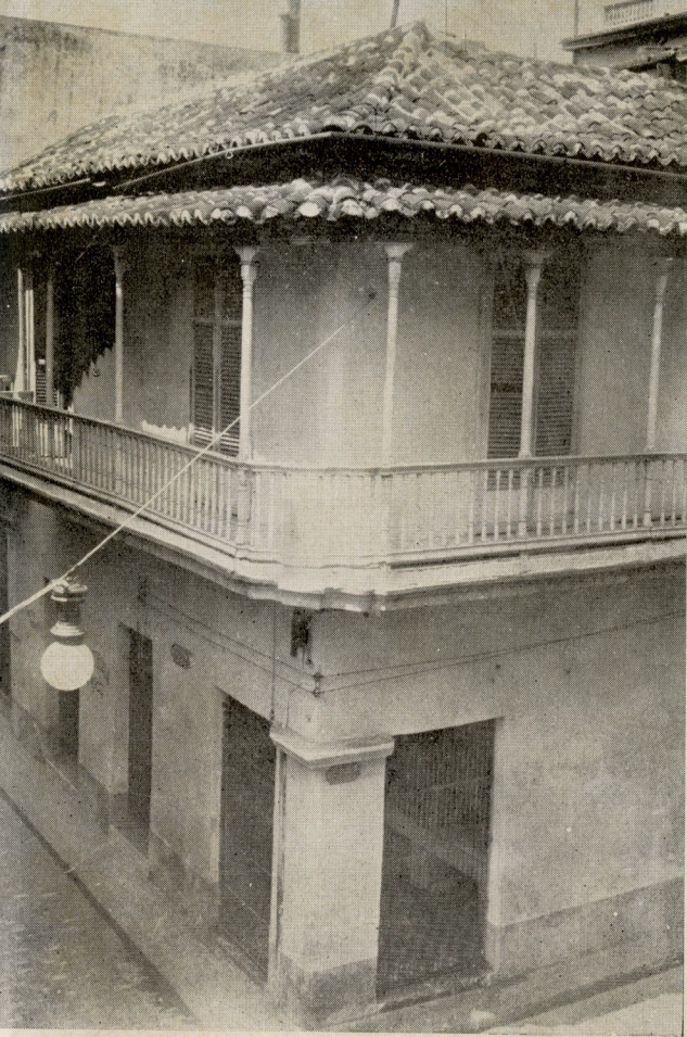
Otro espléndido balcón del siglo XVIII que admiramos en la casa situada en Villegas y Obrapia, de menos riqueza que el otro.