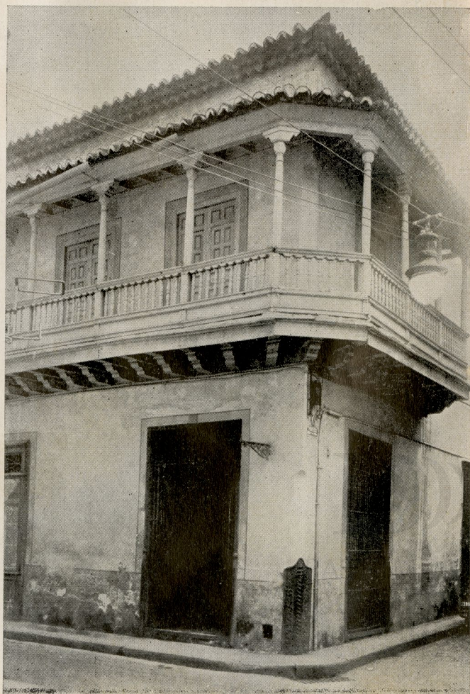
El efecto decorativo de los balcones de la época colonial puede apreciarse en este edificio situado en la esq. de Aguiar y Tte. Rey.

Pero, ¿y qué decir de los balcones?... Porque si en el sentir de Vasari las ventanas son en la fachada de la casa como los ojos en la cara del hombre, ¿no podemos decir de los balcones coloniales que son los labios?... Ellos vigorizan, con su firme acentuación, o animan con su gracia sugestiva, las fachadas coloniales, como los labios dan énfasis y expresión a la cara; y, siguiendo el símil, podemos decir que por el intermedio de ellos “gustaba” el sujeto, aun con mayor delectación que por las ventanas, los diversos manjares callejeros: el vecino que pasa, el novio que acecha en la esquina, la procesión