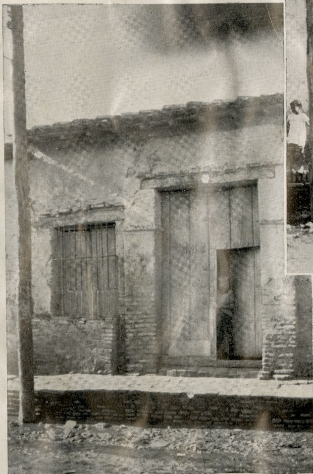
Casa del siglo XVII, típicamente colonial. Bayamo.