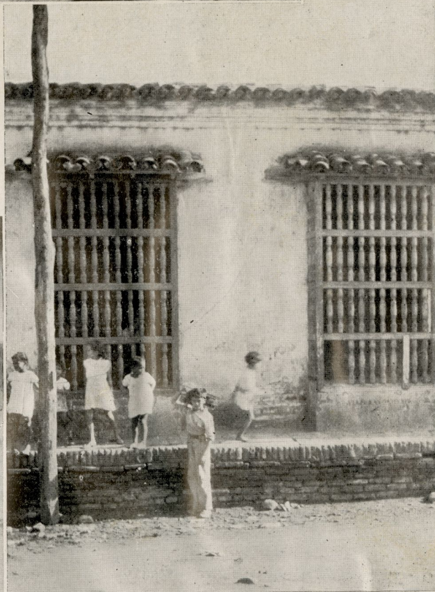
Típica casa colonial del siglo XVIII, mostrando sus ventanas de torneados balaustres de madera. Bayamo.