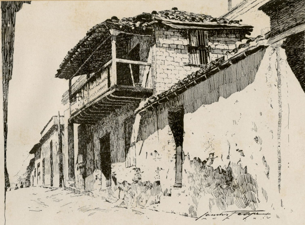
Hermoso balcón, tan ancho y espacioso como un "hall" aéreo, que se admira en una casa típicamente colonial de Santiago de Cuba.