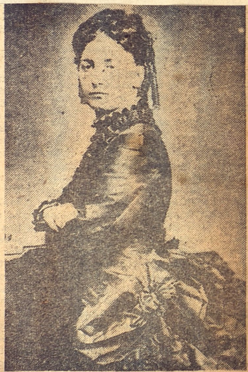
La Condessa de la Torre esposa del Regente, General Serrano