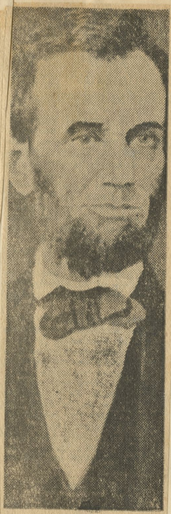
ABRAHAM LINCOLN libertad al negro

Será facultad del Ministro de Gobernación otorgar, de-