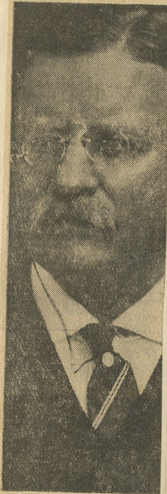
TEODORO ROOSEVELT imperialista

POR TANTO: Mando que se cumpla y ejecute la pre-