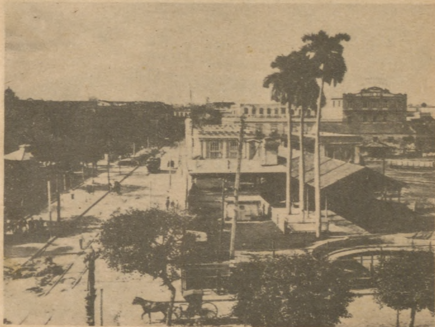
La calle de Dragones.

Los h drán ver siderable ser no só sino tam