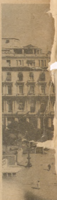
El Parque Central.