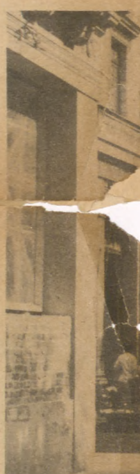
O'Reilly y Aguacate.