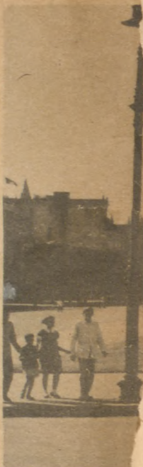
Manzanas comprendidas entre Monserrate y Zulueta, donde hoy se encuentran el Palc