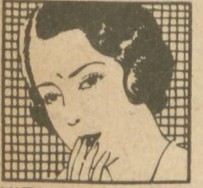
EVITA EL MAL OLOR DE LA BOCA