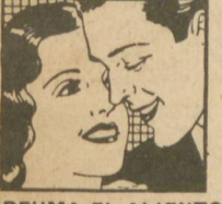
PERFUMA EL ALIENTO