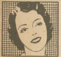
EMBELLECE LOS DIENTES

Embellece los dientes, limpia completamente, fortalece las encías, evita el mal olor de la boca y perfuma el aliento. Comience hoy mismo a cepillar sus dientes siguiendo el "método Colgate."