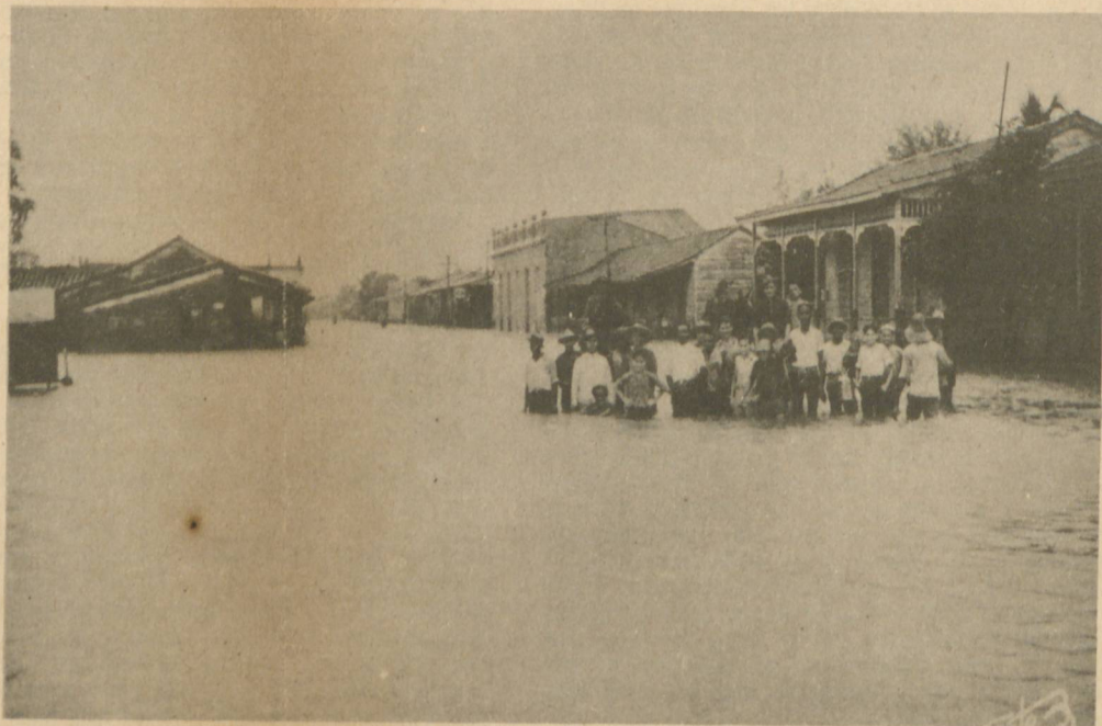
LAS INUNDACIONES EN LA REPUBLICA. —Dos aspectos de las inundaciones en el pueblo de Máximo Gómez, provincia de Matanzas. Las lluvias reiteradas de esta última semana han producido inundaciones en toda la isla y muy especialmente en Matanzas, donde se atribuyen las crecidas a la falta de limpieza del canal del Roque.