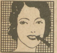
FORTALECE LAS ENCÍAS