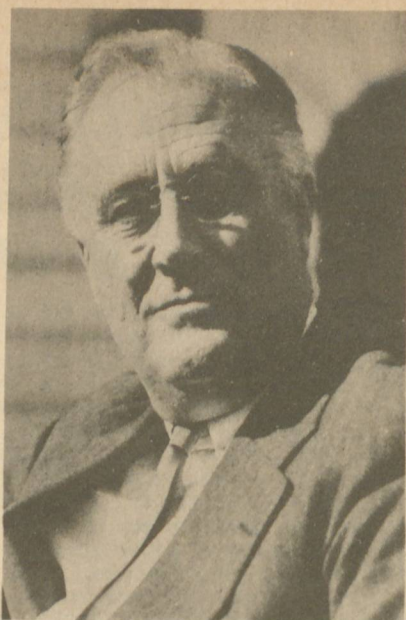
FIRME POR UN AÑO LA CUOTA AZUCARERA. —El Presidente ROOSEVELT, de los Estados Unidos, que sancionó la ley O'Mahoney, por la cual se permite conservar las cuotas azucareras hasta fines de 1937. Esta ley garantiza por el momento la entrada de dos millones de toneladas de azúcares de Cuba en el mercado norteamericano, de acuerdo con el régimen vigente.