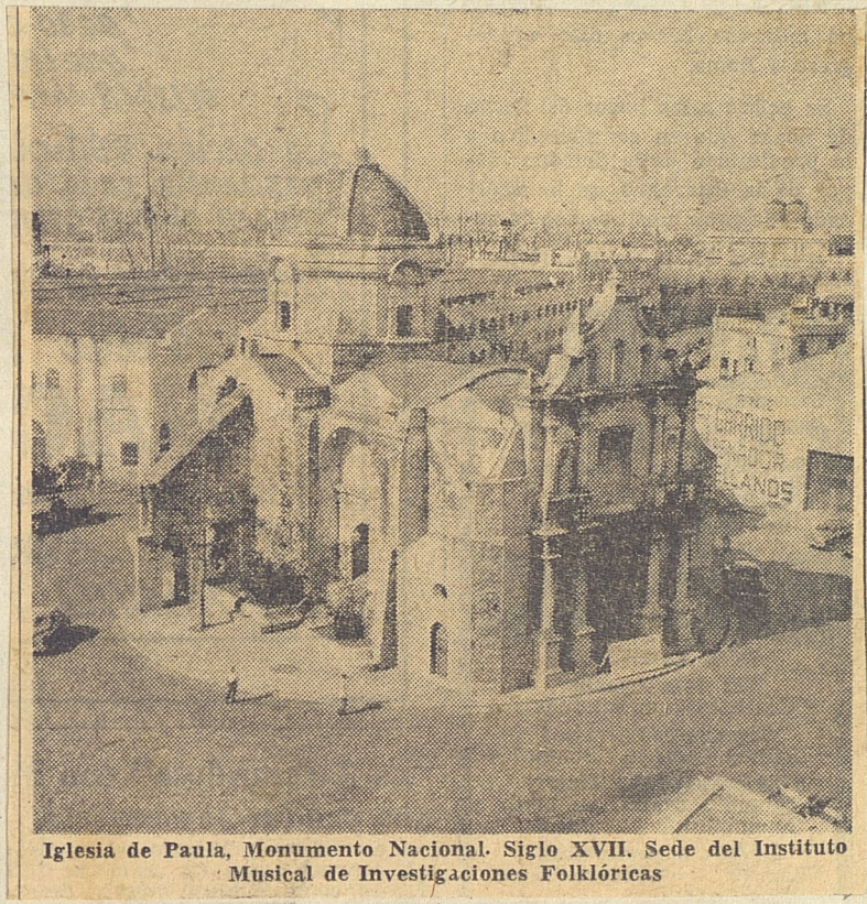
Iglesia de Paula, Monumento Nacional. Siglo XVII. Sede del Instituto Musical de Investigaciones Folklóricas