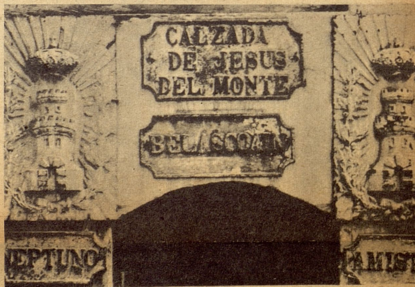
Rincón del patio del Museo Nacional, en el que pueden verse las viejas tarjetas de la Calzada de Jesús del Monte, Belascoain, Neptuno y Amistad.

Ese estudio, según hicimos constar en nuestro informe de 1936, no era sino "la primera parte de otro mucho más amplio, completo y definitivo, que juzgamos indispensable debía realizarse en nuestro término municipal, a fin de dotarlo de una nomenclatura de calles fácil, justa y racional; faltando, por tanto, la revisión total de los nombres de aquellas calles de La Habana y sus repartos que no