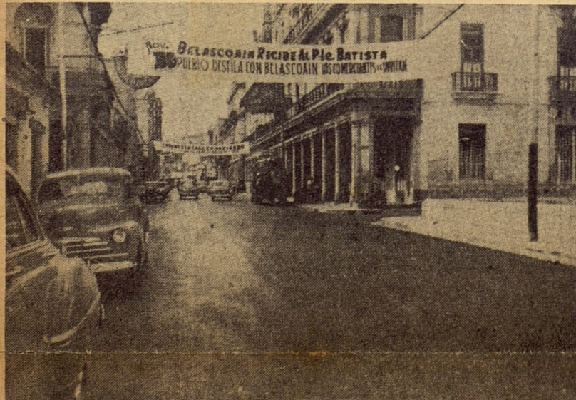
Fotografía publicada en los periódicos de La Habana con motivo de la inauguración de las obras de la Avenida Padre Varela. Según puede observarse, los industriales y comerciantes de dicha calle siguen denominándola Belascoain . Y ello se puso de relieve, nada menos que el pasado año en que se cumplió el centenario del nacimiento del preclaro revolucionario, filósofo y maestro, Félix Varela.