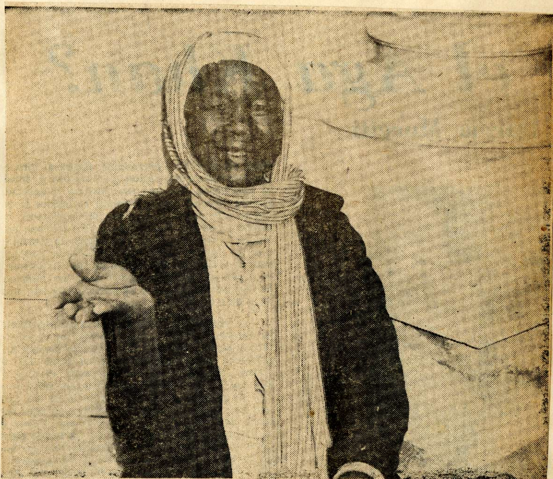
A LA PUERTA de una Iglesia, esta mujer implora la caridad pública, acaso sirviendo a un industrial de la mendicidad.