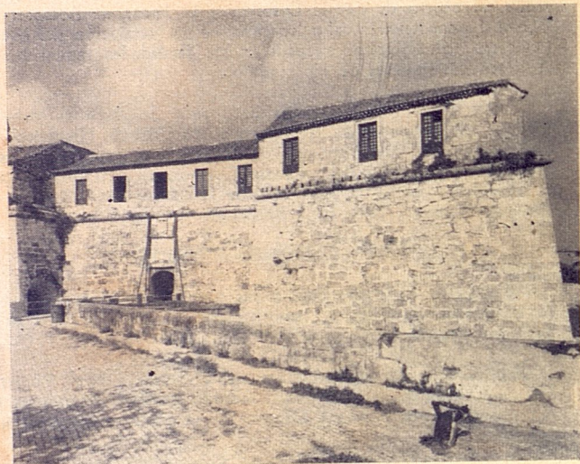
Aspecto de la fachada del Castillo de la Fuerza que será convertido en Museo Histórico y como tal quedará abierto al público en el mes de diciembre.