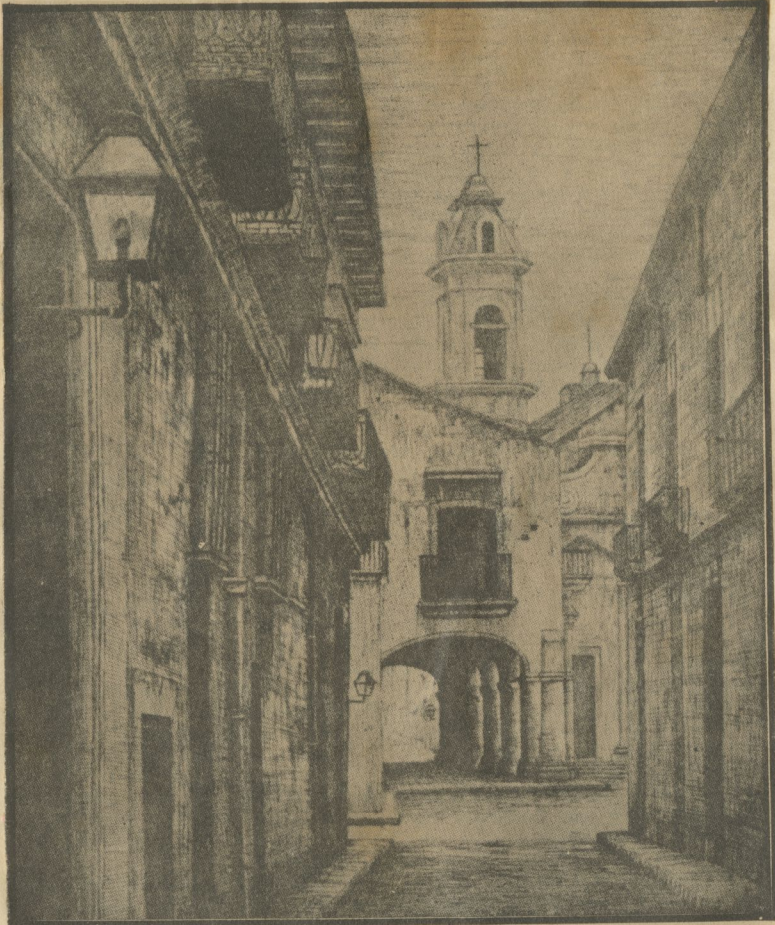
Un aspecto de la Plaza de la Catedral desde la calle de San Ignacio, pudiendo verse la esquina del Callejón del Chorro y el costado de la casa del marqués de Aguas Claras. (Aguafuerte de Ernesto de Blanck).