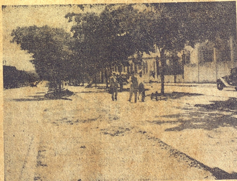
Un aspecto del Paseo de Carlos III, triste y desolador donde puede advertirse la falta de los bancos y del arbolado. Parte de los canteros, que ornamentaban esa ancha vía, han desaparecido...