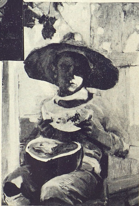
Joaquín Sorolla. El Niño de la Sandía.