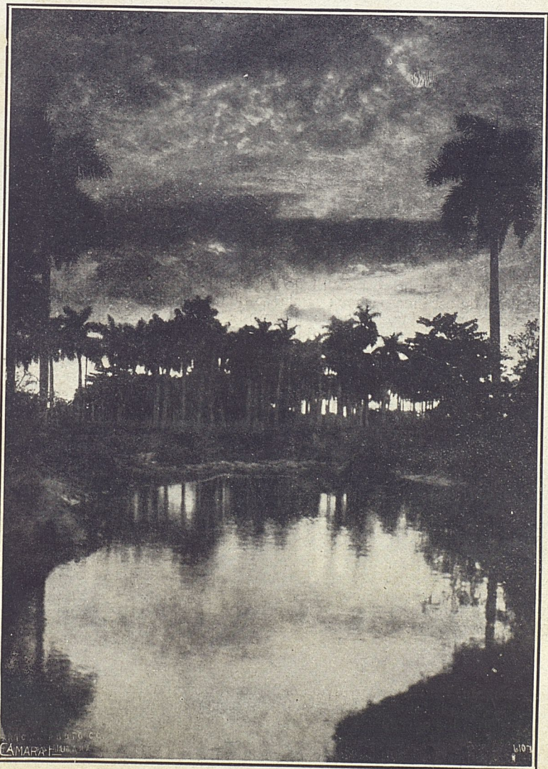
Un paisaje de Santiago de Cuba