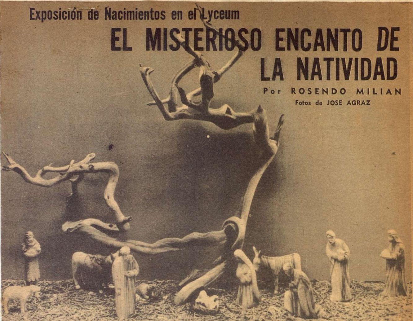
Hecho en Jerusalem, la tierra legendaria del Salvador, este nacimiento está tallado en madera de olivo. Tiene una atmósfera de melancólica tristeza.