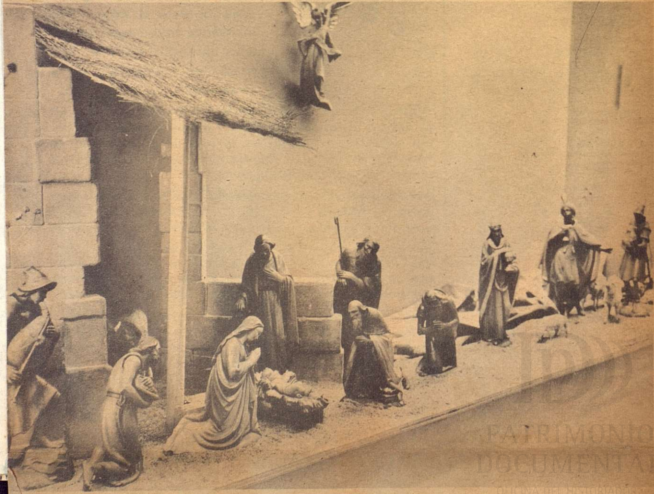
Estilo clásico, italiano. Talla en madera. Las figuras están terminadas. Este es uno de los mayores y mas hermosos Nacimientos del salón.

HERNANDEZ PATRIMONIO DOCUMENTAL DE LA NAVE DEL HISTORIADOR