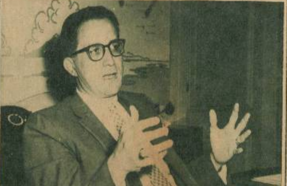
"Cualquier banco cubano puede tener el efectivo que necesite en caso de emergencia".