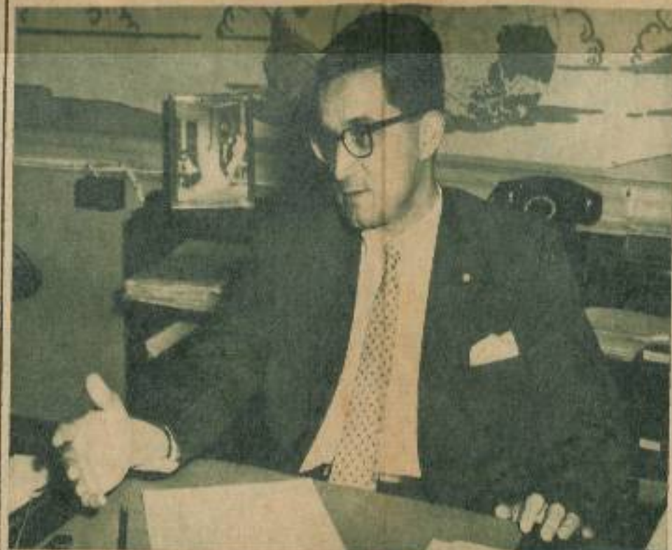
"Los bancos cubanos están haciendo préstamos a largo plazo".