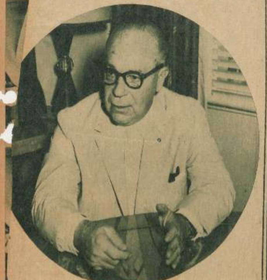
"La eficacia del sistema bancario ha impulsado el desarrollo económico nacional".

de que éstas están sujetas a determinadas condiciones para su entrega, los bancos las hicieron efectivas en el acto. En definitiva —concluye el doctor Rodríguez Lendían— los bancos cubanos han demostrado, en todos los órdenes, capacidad y solidez para jugar el importante papel que les corresponde en el desarrollo de la economía nacional.