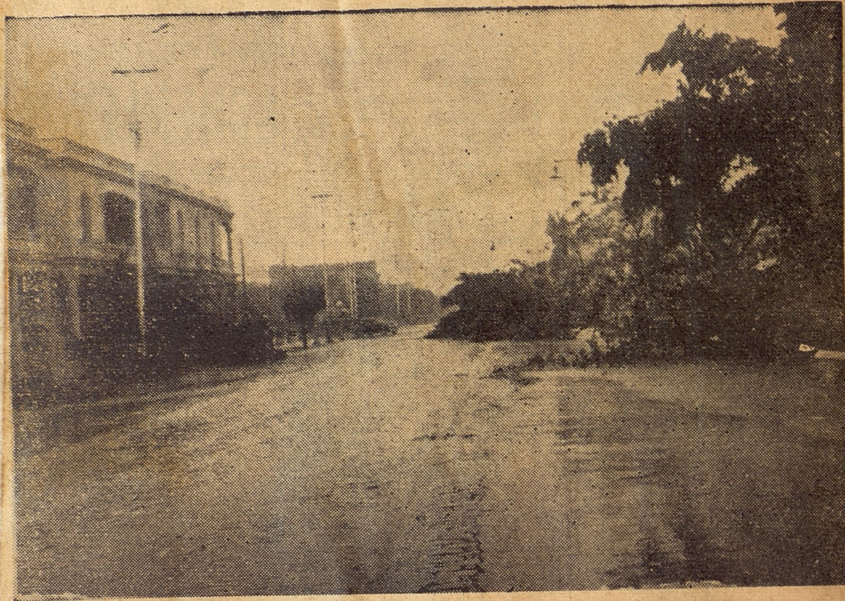
La Calle 23, en el Vedado, quedó casi enteramente bloqueada por los grandes árboles que la adornaban. Esta vista puede dar una idea de la situación en que deben hallarse las carreteras de la República.