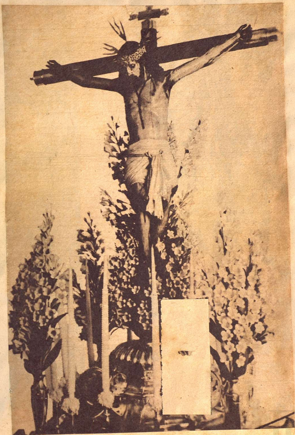
El Cristo de la Vera Cruz, que se venera en la ciudad de Trinidad.