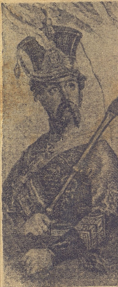
El Conde de Belascoain, fusilado en Madrid por Espartero y que dió su nombre a la Calzada, como un homenaje que le tributó O'Donnell a su memoria.