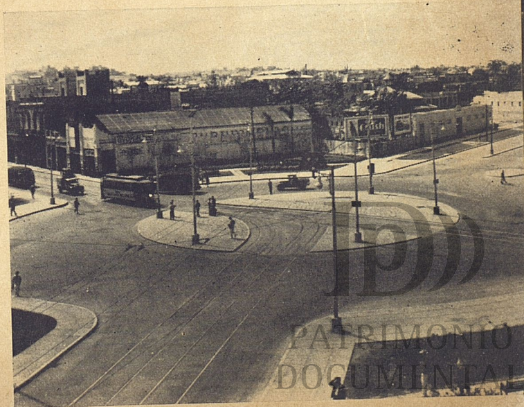
Vista general de la Plaza de Agua Dulce.