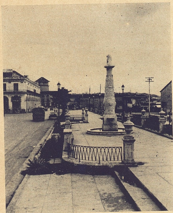
Vista General de la Alameda de Paula, después de su restauración.