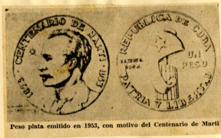
Peso plata emitido en 1953, con motivo del Centenario de Martí