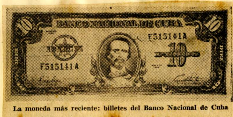
La moneda más reciente: billetes del Banco Nacional de Cuba