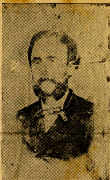
Eligio Izaguirre, secretario de Hacienda del gobierno revolucionario de Céspedes

En relación con la famosa colección de monedas que poseía el rey Farouk considerado como un fanático ferviente de la numismática, se sabe que cuando se produjo la subasta en el Cairo