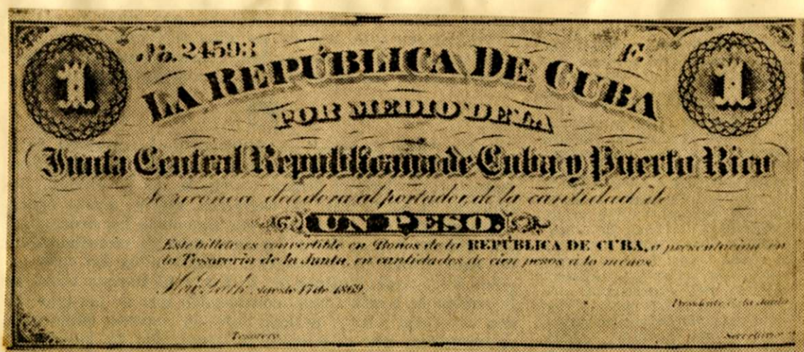
Billete revolucionario de la Junta Central de Cuba y Puerto Rico