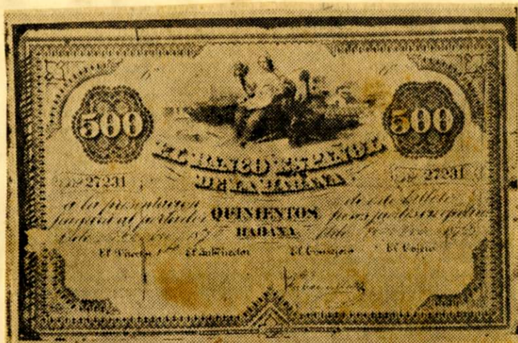
Los billetes del Banco Español, anteriores a la moneda cubana