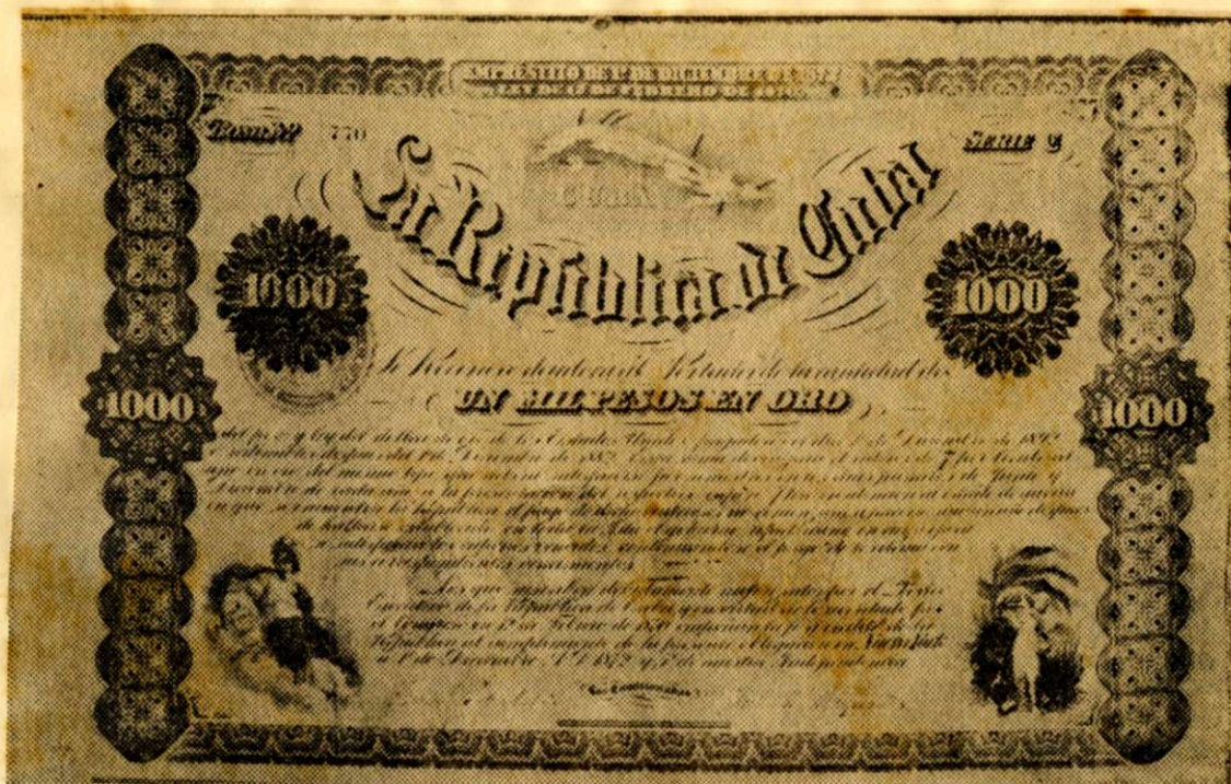
Bono emitido por el gobierno revolucionario cubano en 1892